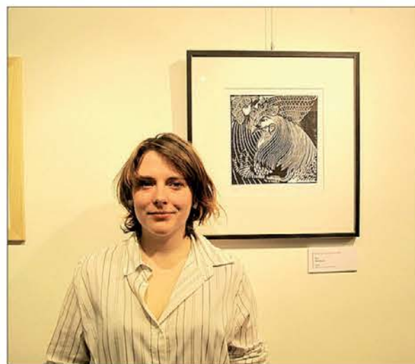
Posnetka z razstave v tržaškem Narodnem domu