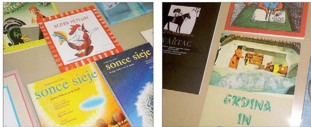
Na pobudo ISK an kd Trinko je biu v Špietru liep večer posvečen pravcam. Lahko smo videli številne publikacije, ki so paršle na dan v zadnjih letih v naših dolinah od Rezije do Terskih an Nadiških dolin

Na ogled številne publikacije naših društev