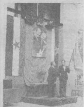
Novi prapor društva upokojencev