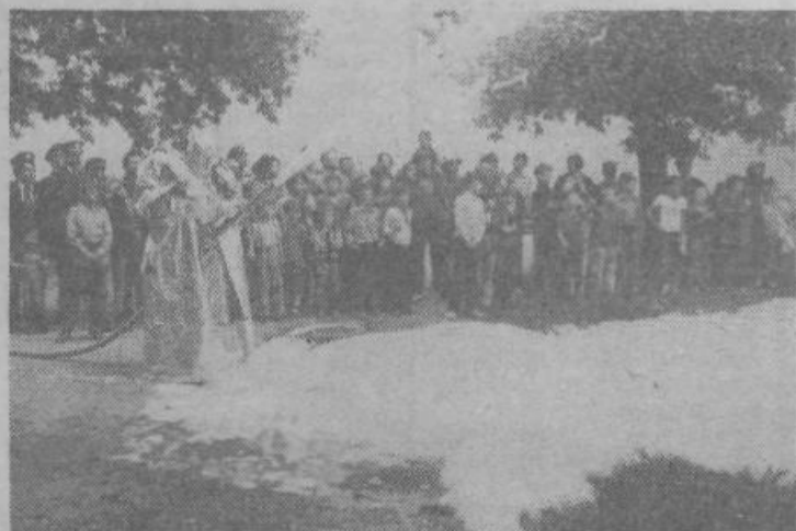
Demonstracijska vaja — gašenje s sodobnimi sredstvi v templeks oblekah