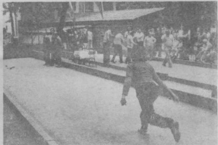
Baliranje je privlačen šport