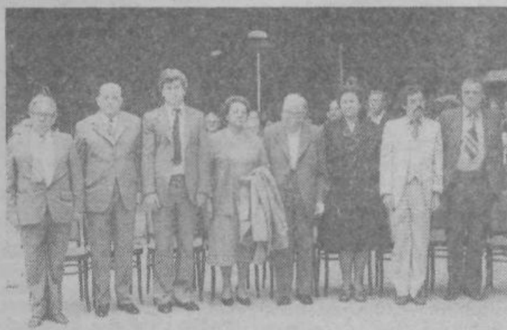
Gostje na proslavi našega praznika ob intoniranju himne

Kulturni program so izvajali pionirji OŠ Edvarda Kardelja in Leopolda Mačka — Boruta in mladina krajevske mladinske organizacije.