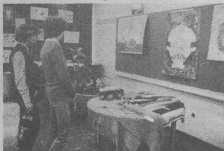
Razstava likovnih izdelkov in ročnih del

V okviru praznovanja so sodile še druge prireditve, kot VII. tradicionalni balinarski turnir 12 ekip v organizaciji KBK Sloga, turnir v malem nogometu, veliki hitropotezni turnir šahovskega društva ter razstava likovnih izdelkov in ročnih del krajanov. Posebno je popestrila prireditev recitacija učencev OŠ Leopolda Mačka — Boruta pod naslovom Naš kraj, v kateri so ponazorili dobre in slabe plati naše KS.