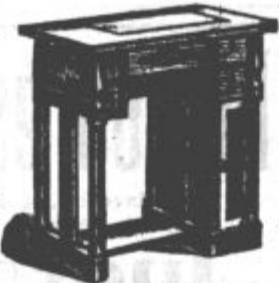
Vočletna garancija! Post v vosezju brezplačno!

„GRITZNER“ „ADLER“ in kolesa, najboljši material, precizna konstrukcija, krasna oprava ter najnižja cena so samo pri