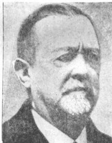
Svinhufvud, novi predsednik finske republike

Slika nam kaže papeža Pija XI. pred mikrofonom, govorečega svoj znameniti nagovor »na vse«. Na levi strani slike stoji državni tajnik kardinal Paccelli, v ozadju pa izumitelj Marconi, ki je napravil oddajno postajo v Vatikanu.