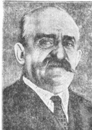
Grof Romanones, voditelj španskih liberalcev, ki je povzročil demistjo vlade Berenguera.