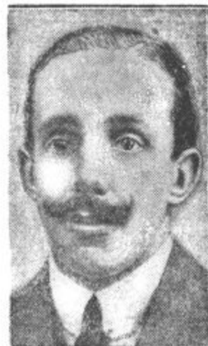
Španski kralj Alfonz XIII.