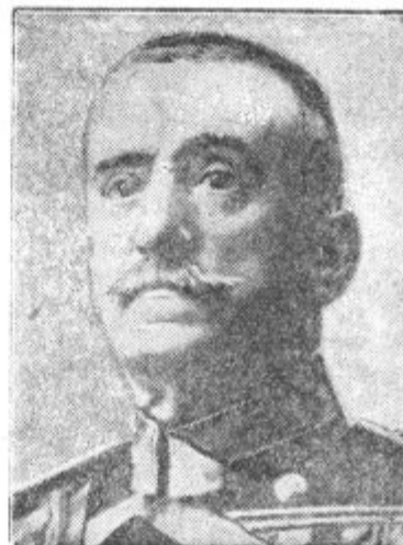
Admiral Aznar, predsednik nove španske vlade

Na sliki vidimo porušeno cerkev v Korči, kjer je bilo središče potresa. Potres je napravil ogromno škodo, človeških žrtev pa ni bilo