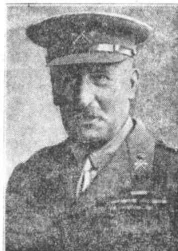
Španski infant Don Carlos, ki utegne postati bodoči španski kralj, če odstopi Alfonz XIII.