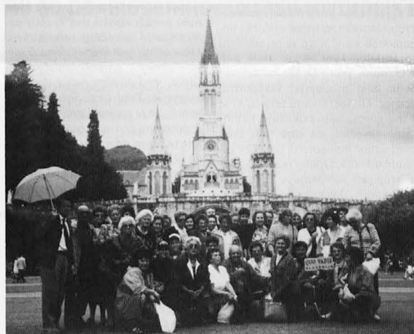
Doberdobski župljani pred baziliko v Lurdu

Prvič v zgodovini Doberdoba smo imeli župnijsko romanje v Lurd. Kot župnija radi romamo, vendar v tem prelepem Marijinem svetišču pod Pireneji smo bili prvič. Nekateri naši so že bili tam, vendar ne skupaj kot župljani.