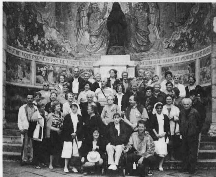
Romarji v Lurdu