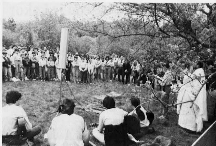
Prizor iz življenja tržaških skavtov