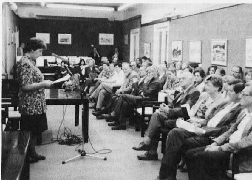
Proslava sedemdesetletnice pisatelja Rebule v Društvu slovenskih izobražencev v Trstu

Ne dam dosti na takšne mejnike. Neki moj znanec ni mogel zaspati od razburjenja tisto noč, ko je od 49. leta prehajal v 50. Jaz te koledarske mejnike mirno prespavam. Nismo vsako sekundo na tem, da naredimo zadnji usodni prestop? (se nadaljuje na 4. str.)