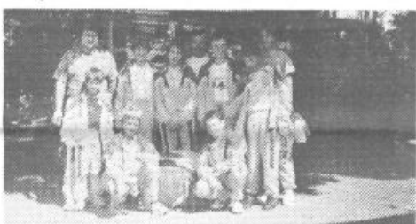
Mlada namiznoteniška ekipa ŠD Podpeč-Preserje

Zgraditi je bilo potrebno nov dimnik. Zgrajena je bila tudi tuš kabina. Potrebno pa bo pred mrazom še toplotno izolirati strop v celem objektu, za kar pa nam manjka sredstev. Radi bi tudi uredili garderobe za igralce. Z ogrevano dvorano smo prišli do prostora, ki je uporaben celo leto, izjemoma tudi za druge namene.