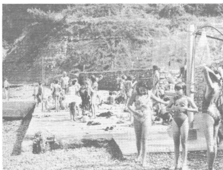
Moji mali prijatelji iz zavoda za slepo in slabovidno mladino so se radi postavili pred fotoaparata! Le naj se pogledajo, kako so se vsak dan odpravljali na kopanje.