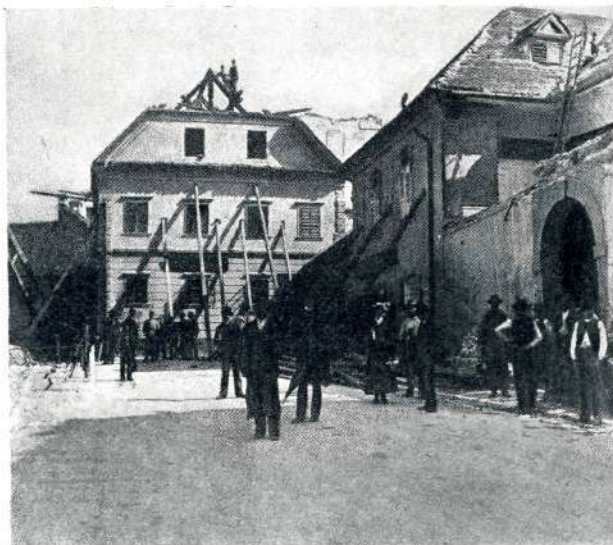
Hiša, v kateri je umrl Val Vodnik. (Pogled od južne strani.)

»Slovenski Narod« z dne 13. decembra 1918 kakor tudi prva letošnja številka »Ljubljanskega Zvona«