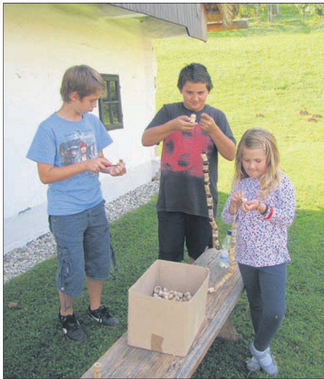
Delavnica izdelovanja igrač v muzeju na prostem v Rogatcu