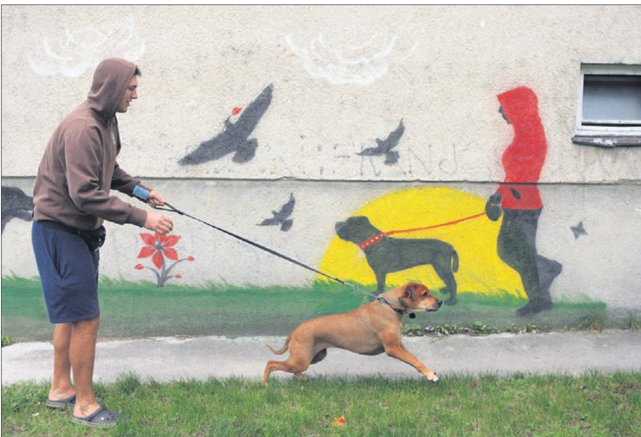
Sreča na vrvici