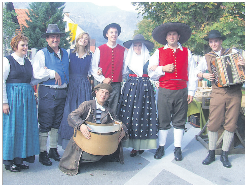
Nekateri od likov, ki so obiskali Lenartov sejem.

REČICA OB SAVINJI – Člani turističnega društva so v nedeljo znova uspešno izpeljali 17. Lenartov sejem, v katerim skušajo obuditi spomin na sejmski živ-žav, ki je odlikoval Rečico ob Savinji med obema vojnama.