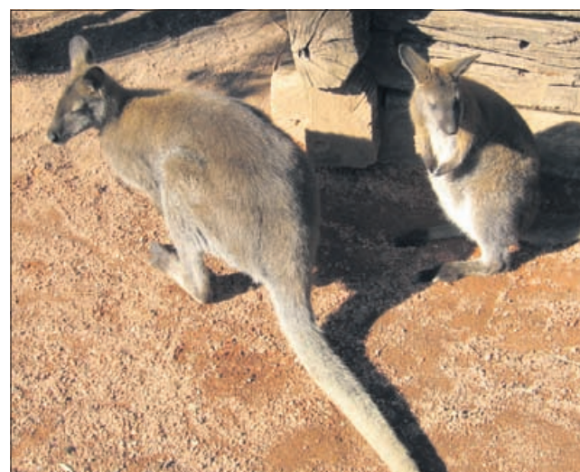
Kenguruji pod Pohorjem. Parček, ki je odrasel na Nizozemskem, je imel podmladek že drugo leto zapored. V Konjicah tako poskakuje pet kengurujev.