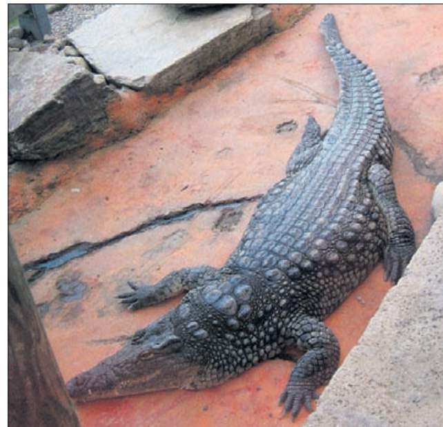
Konjiški krokodil je v prostoru z ogrevanim bazenom ter z navlaženim toplim zrakom, ki spominja na tropsko podnebje.