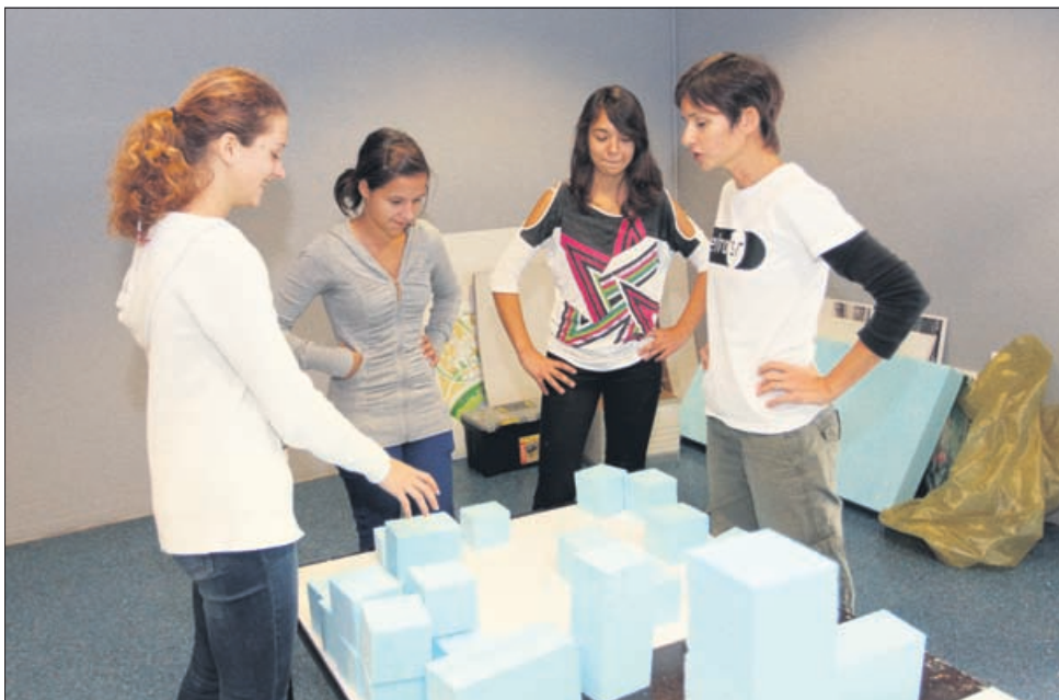
V Celjskem mladinskem centru je ob spodbudah arhitektov skozi roke mladih raslo mesto za mestom.