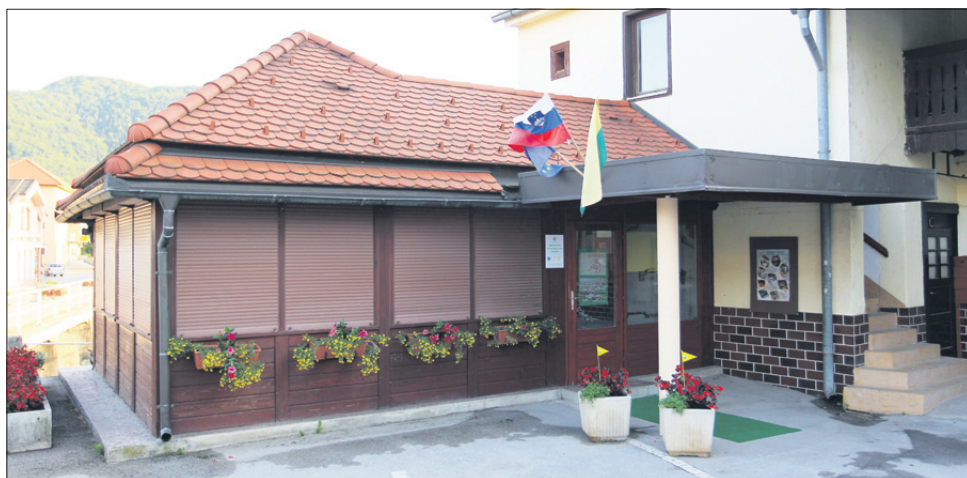
TIC Prebold, ki domuje na nekdanji domačiji v neposredni bližini Bolske, so med poletnimi počitnicami uredili dijaki in študenti v sklopu počitniškega dela.