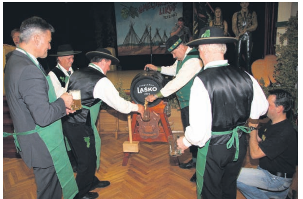
Točenje piva ob koncu Hmeljarskega likofa, s katerim so tudi letos hmeljarji simbolično obeležili konec obiranja hmelja.

Društvo hmeljarjev, hmeljskih starešin in princes je tudi letos podelilo priznanja najzaslužnejšim hmeljarjem, ki kljub krizi še vedno vztrajajo in pridelujejo hmelj, pri tem pa še vedno ostajajo op-