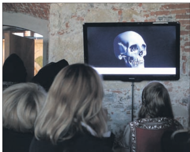
Na razstavi o Celjskih so na ogled tudi slovite lobanje.

Obnovo je Mestna občina Celje speljala s sofinanciranjem evropskega sklada za regionalni razvoj, ministrstva za izobraževanje, znanost, kulturo in šport ter svojimi sredstvi, stala pa je malo več kot 2 milijona evrov.