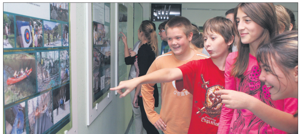
Fotografska razstava ob prehojeni 50-letni poti je še zlasti zanimiva za učence, ki danes obiskujejo IV. OŠ Celje.