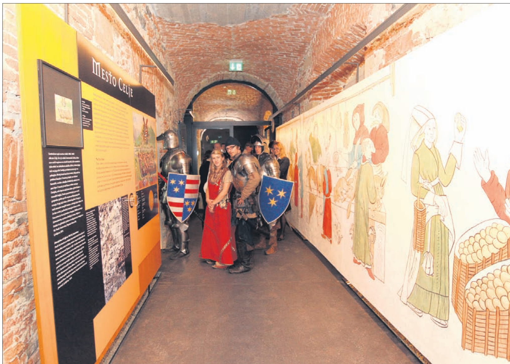
Prostori, v katerih je postavljena razstava o Celjskih, so obnovljeni premišljeno, z izjemnim čutom za estetiko, tako da že sami po sebi, brez razstave, pripovedujejo čudovito zgodbo.