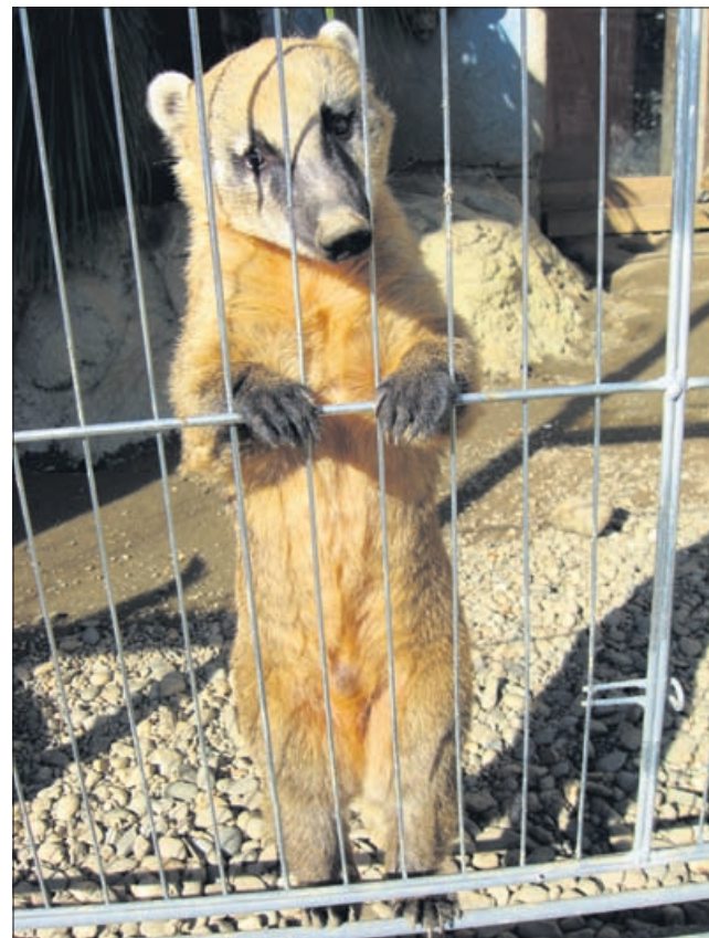
Imaš kaj zame je verjetno vprašal nosati medvedek koati, ko se je postavil na zadnji tački.