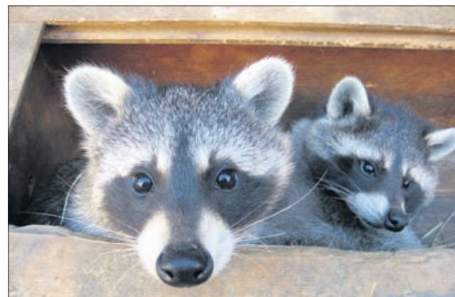
Rakuna smo zmotili med popoldanskim lenarjenjem.