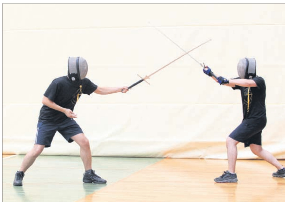
Ena najbolj priljubljenih avtohtonih borilnih veščin je boj z dolgim mečem.

Tehnike bojevanja z dolgim mečem so zapletene, zato morajo ljubitelji najprej opraviti veliko skupinskih in rutinskih vaj, šele nato se lahko lotijo dvobojevanja. Osnova za boj je pet prež in z njimi povezanih udarcev. Prva je preža z vrha , kjer meč počiva na desni rami oziroma ima bojevalec roke in meč dvignjene nad glavo. Druga je volovska preža , kjer bojevalec drži meč s prekrizanima rokama na desni strani nad glavo, konica meča pa je usmerjena v nasprotnikovo glavo. Plužno prežo poznavalci imenuje-