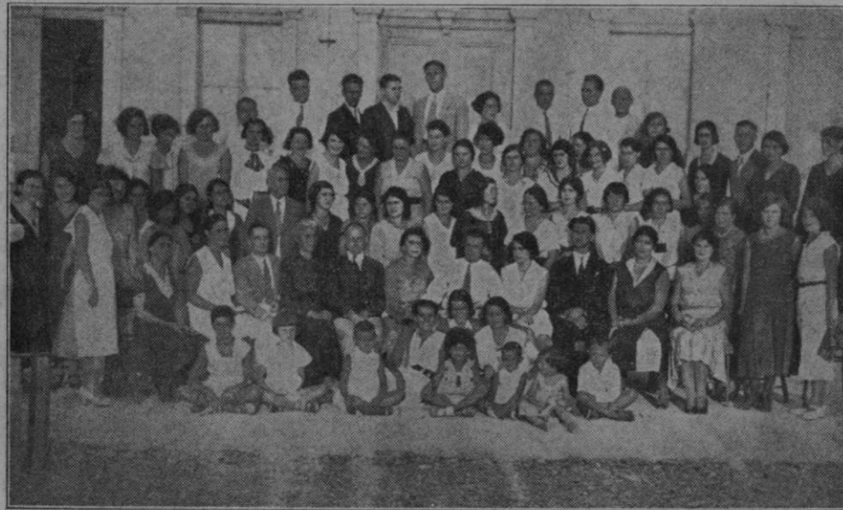
Udeleženci in udeleženke letovanja v Velaluki.

Že smo ob vznožju Lovčena, v Kotoru! Od vseh strani je mesto obdano z močnimi in visokimi zidovi. Največji in najlepši fort je bil sezidan leta 1855. Cerkve so vse še iz 12. in 13. stletja, z arhitektoničnimi spomini. V Kotoru je muzej »Bokeške Mornarice«, ki obstoja že preko 1000 let, dalje mestni muzej, vrhu Kotora pa trdnjava Sv. Ivan. Za časa našega prihoda je bil ravno semenj, na katerem je bilo mnogo slikovitih narodnih nož iz Boke in Črne gore.