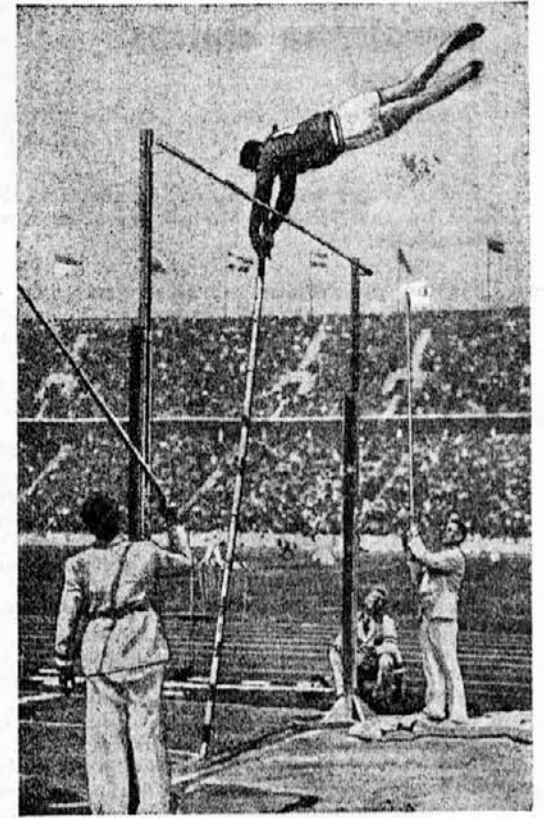
Krasen skok Amerikana Graberja s palico.

1767 ni bilo med Ognjeno zemljo in med Panamo nobene bogatejše pokrajine, kakor Chiquitos. Bogata je bila v poljedelskem smi-