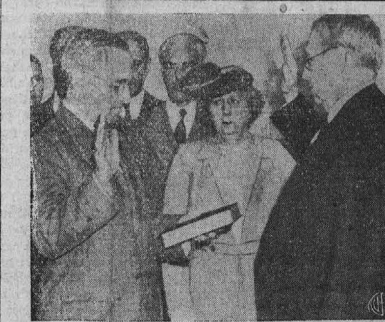
Novi predsednik Zedinjenih držav, Harry S. Truman, ko polaga zaprisego kot 32. predsednik ameriške Unije. Zaprisegel ga je predsednik najvišjega sodišča, Harlan Fiske Stone. Zadej stoji Mrs. Truman, a za njo je državni tajnik Stettinius.