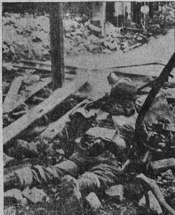
V mestu Coblenc v Nemčiji, katerega so zavzele čete generala Pattona, so se vršili srditi boji po ulicah, kajti Nemci so se skrivali po hišah in iz zasede napadali naše vojake. Na sliki vidimo enega naših vojakov, ki leži pripravljen s strojnico, da prežene sniperje iz razvalin v ozadju slike.

"Upam, da to za nas ne bo imelo nič neprijetnih posledic!" (Dalje prihodnjic.)