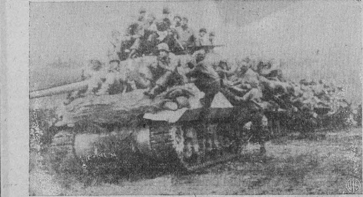
Vojna fronta na zapadnem bojišču se pomika v Nemčijo s tako naglico, da so vojaki naše 9. armade poskakali na tanke, da so mogli dovolj hitro za umikajočim se sovražnikom. Slika je posneta na vzhodni strani reke Rene, kjer so naši vojaki naleteli na jako malenkosten odpor Nemcev.

ogelj gledal smrti v oči, ko so se odigravale žalostne scene nad trpečim in zbičanim narodom, ko mi je pogled prazno blodil po mrzlih valovih Baltiškega morja (Luebeck); ko je žgoče in neusmiljeno sonce pripredalo po kamenitih pečinah, ko sem v neskončnem hrepenenju po domovini, mojimi dragimi in družini, sem se ušel v svojstva pobeglega vojnega ujetnika, pri čemer sem neštokrat tvegaval svoje življenje, kajti zasledovalci so mi bili vedno tesno za petami; z divjih in visokih Pijemontskih gora v daljave — glede na moje tedanje stanje in položaj — brez vsega in popolnoma fizično izčrpan v nedoosegljive vrhove Julijskih alp, ali pa čez modre valove krasnega Ligurijskega morja upiral pogled v skalnato obalo Korzike, odkoder sem pričakoval rešitve.