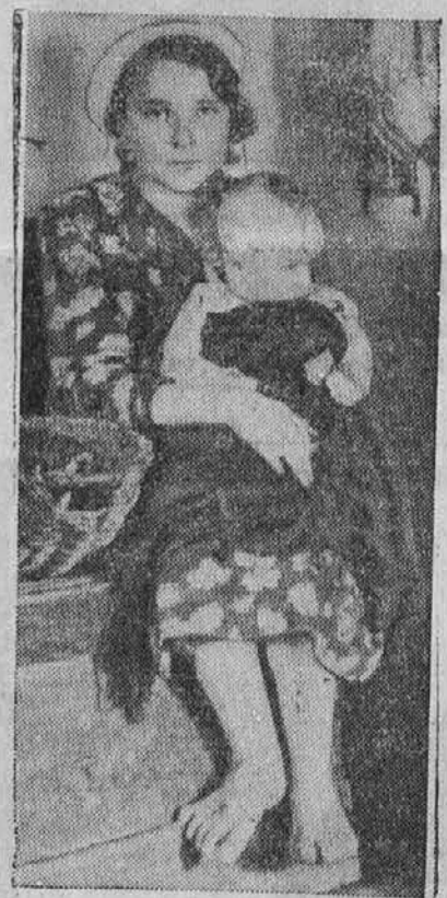
Nekje na Poljskem. — V neimenovanem kraju na poljskem je fotograf posnel sliko bosonoge matere in njenega otročička, ki je zavil v neko staro zaveso, da ga ne zbe. Milijone židov Evrope je še slabše obledelih. Tudi vi lahko pomagate tem sirotam, da jih obvarujete mraza in raznih boleznih s tem, da darujete svojo ponošeno in še uporabno obleko v kampanji United National Clothing Collection, ki se vrši do konca tega meseca.

Sicer je vse minljivo in sponin na bližnjo preteklost, v kateri sem nastopil svojo trnjevo pot in ko sem skozi dim in