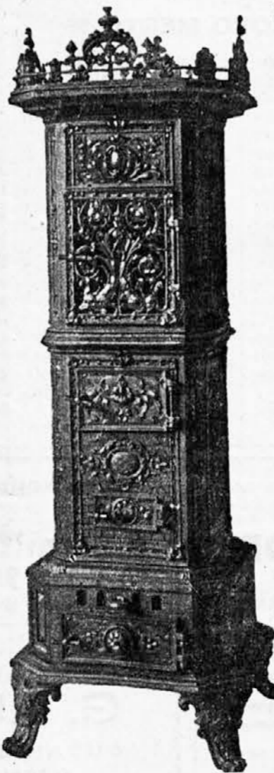
Salonska peć za ugljen.

Poštanska i željeznička stanica: Vareš — Majdan