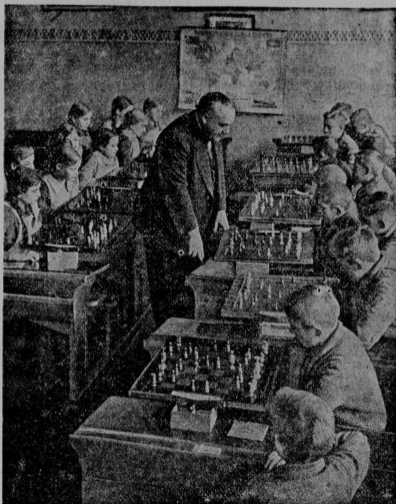
Posebno presenečenje je doživela vas Ströbeck (saška provinca), kjer se staro in mlado z gorečo vnemo bavi z igranjem šaha. Tu se je šah celo v šolo uvedel kot predmet. Slavni šahovski mojster Bogoljubov je pred dnevi obiskal to vas in se udeležil šaha med ljudskošolskimi otroki, kakor vidimo na sliki, kjer pa se je moster izredno čudil nad nadarjenostjo mladih šahistov.