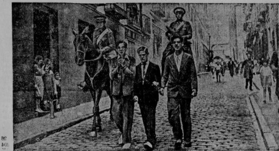
Novi nemiri v Spaniji. Od odkritja zadnjih prevratnih načrtov vre v Spaniji zmerom močnejše. V Barceloni je prišlo do krvavih poulitnih bojev, kjer so igrane bombe in ročne granate posebno močno ulogo. Podobni nemiri so se pojavili v Madridu in ostalih mestih. — Slika: Mlade komuniste gonijo v madridske zapore.