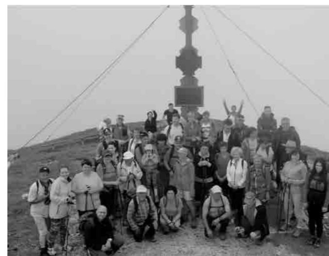
Pohodniki na vrhu Obirja

Pohod smo pričeli na nadmorski višini 460m v naselju Kal Koritnica. Tura bi glede na samo višino gore, ki za nas po-