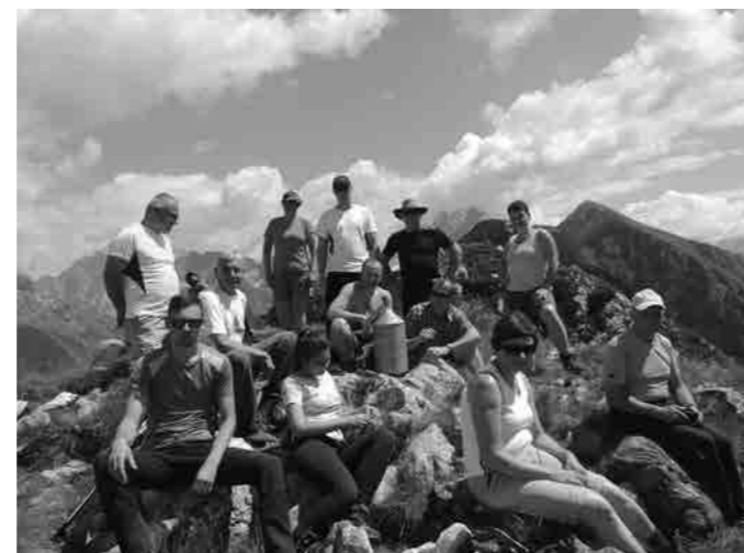
Pohodniki na vrhu Svinjaka

hodnike ni posebno visoka, lahko bila nekaj zmerno zahtevnega. Žal pa smo kmalu spoznali, da je to kar zaresna tura. V začetku nas je spremljala izredno visoka vlaga in popolno brezvetrje, ki je iz nas izsesalo skoraj vso telesno tekočino. Zadnji del vzpona je bil zaradi vzgonskega vetra lažji, vendar