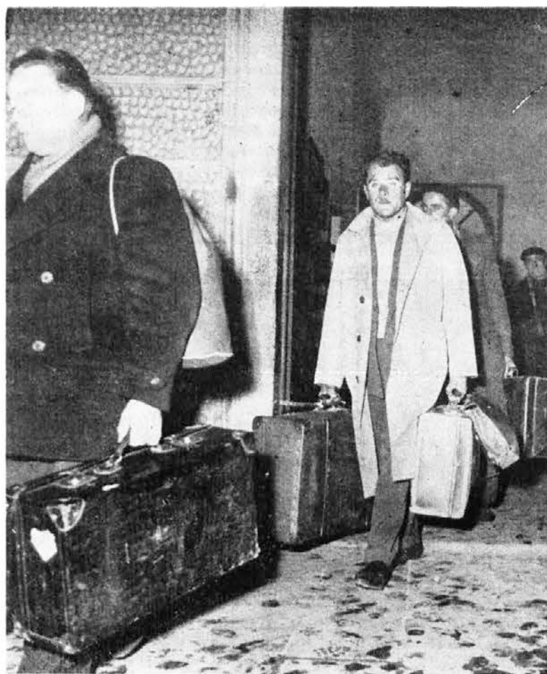
La costruzione di uno stabilimento nel Friuli per la trasformazione del materiale estratto nelle miniere di Raibl sarà un passo avanti per contenere il doloroso fenomeno dell'emigrazione - Nella foto: Emigranti che rientrano alle loro case all'uscita della stazione di Udine.