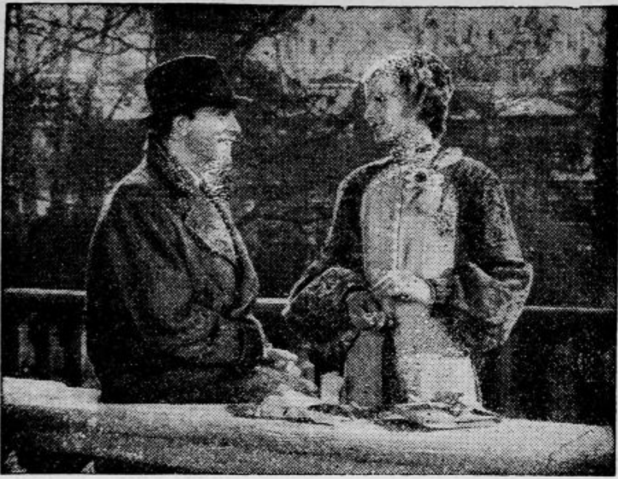
Willy Fritsch in Lilian Harvey sta spet skupaj in sicer v novem Ufinem zvočnem filmu prečudnega imena »Sedem klofut«