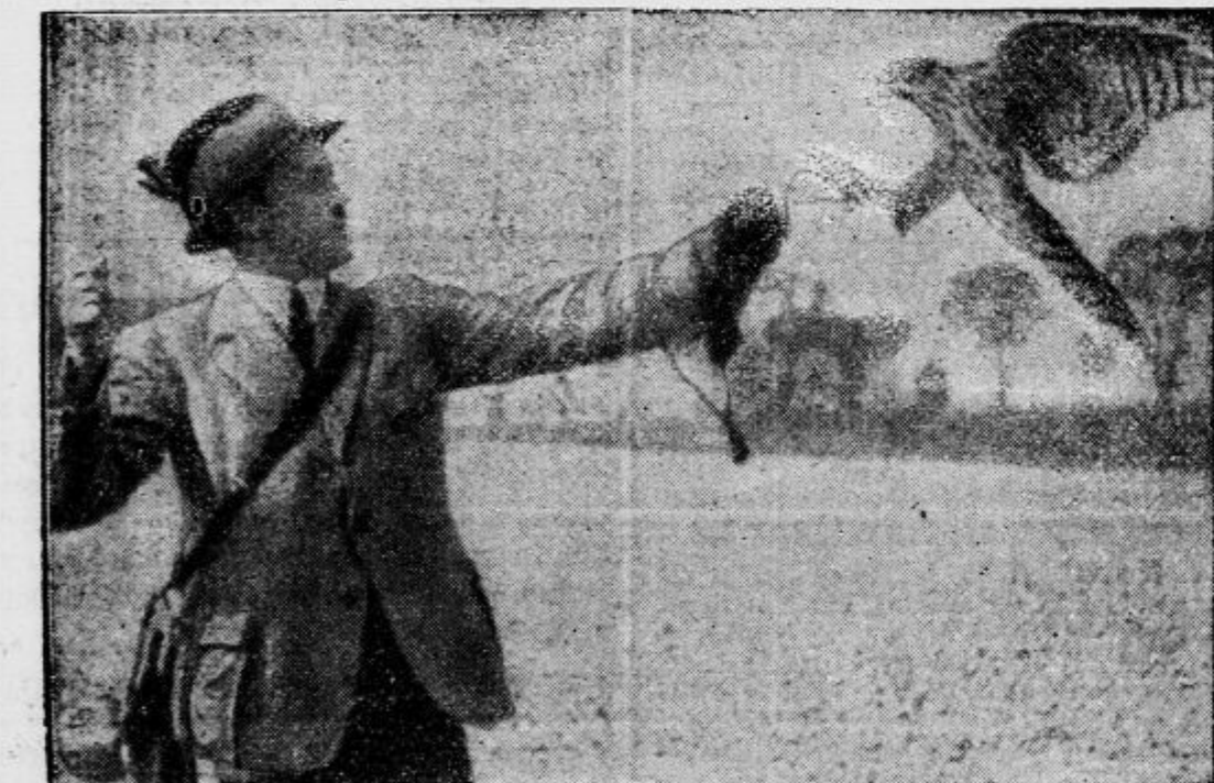
Kragulj je ubogljiv... Prizor iz kulturnega filma: »Živali — pomočnice na lov«

Zbiralce, ki se zanimajo za razne španske znamke iz sedanje dobe, moramo opozoriti, da obstoji dosti falsifikatov, ki prihajajo po večini iz Francije in Španskega Maroka. Tudi sicer je težavno ugotoviti, katere znamke so službene in katere so samo plod spekulacije. Zlasti je treba biti previden pri raznih znamkah (zasilnih), ki so izšle po raznih španskih mestih.