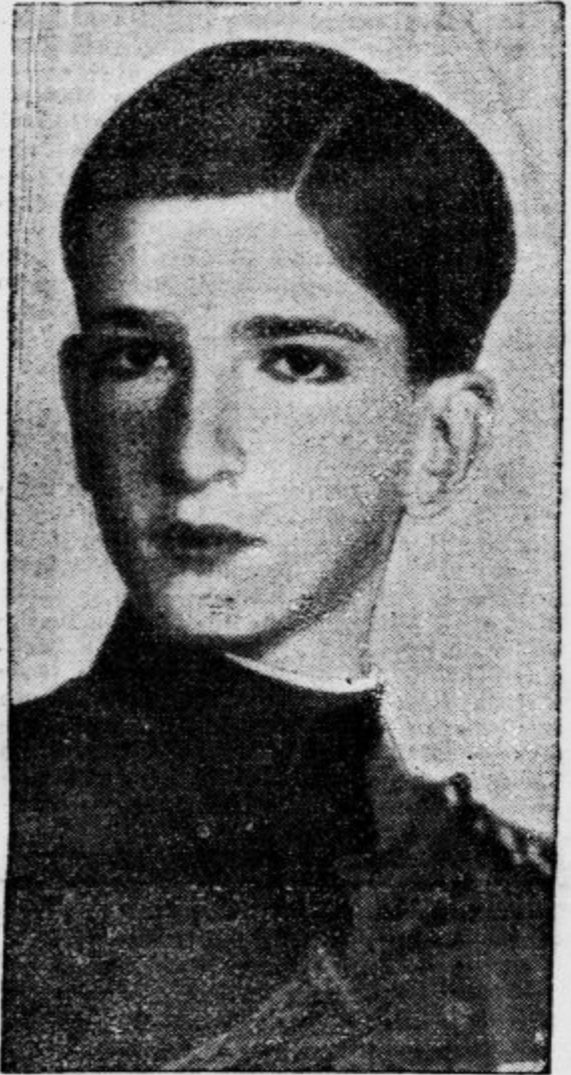
Starešina SKJ Nj. Vel. kralj Peter II