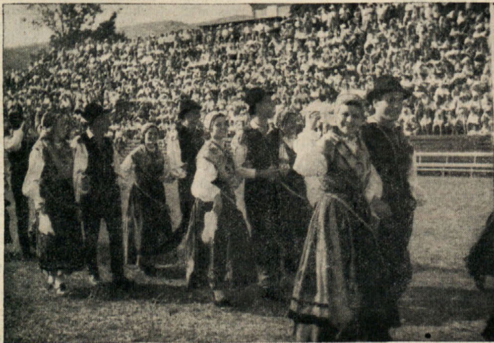
Dan „Slovenske kulture“ v Trstu