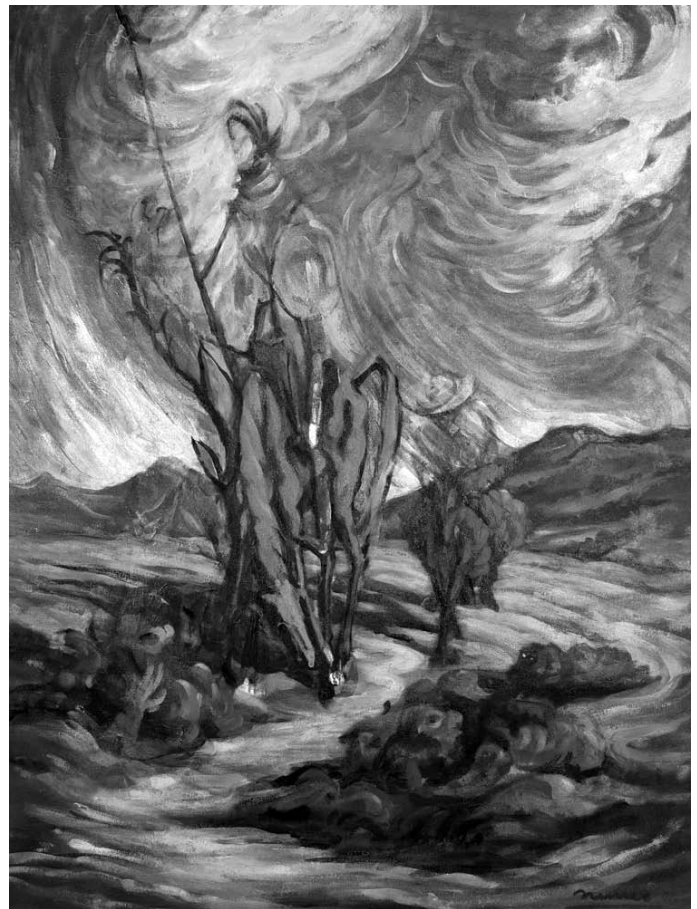
Don Kihot, 1960, olje in tempera, lesonit, 170 x 130 cm, sig. d. sp.: Nemec 1960 (Goriški muzej)

V zapuščini so tudi fotografije ; na najsta-