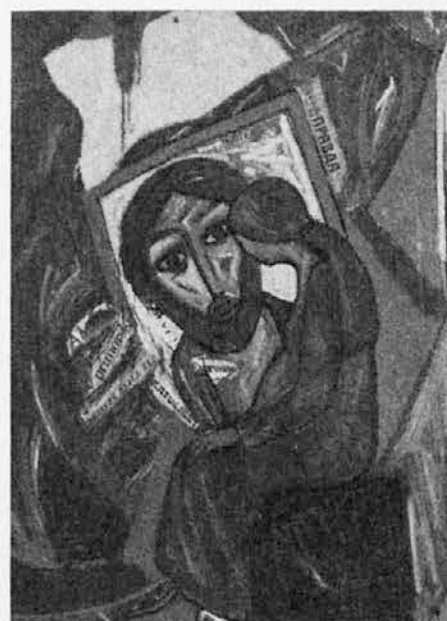
Kristus in Magdalena