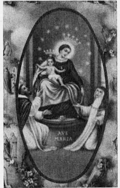
Mesec oktober — mesec rožnega venca

Kitajska republika je prepovedala, da bi letalo sv. očeta letelo čez njeno ozemlje. V zameno je Sovjetska zveza dala svoj pristanek. Zato bo papež prvič v zgodovini letel čez evropsko Rusijo in Sibirijo do Koreje. Njegovo letalo se bo ustavilo tudi v Moskvi.