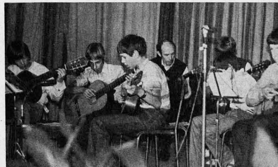
Skupina kitaristov goriških glasbenih šol, ki so do leta 1988 delovale v okviru ZSKP. S tem letom se je ustanovil Slovenski center za glasbeno vzgojo »Emil Komel«, ki ima nad sto gojencev