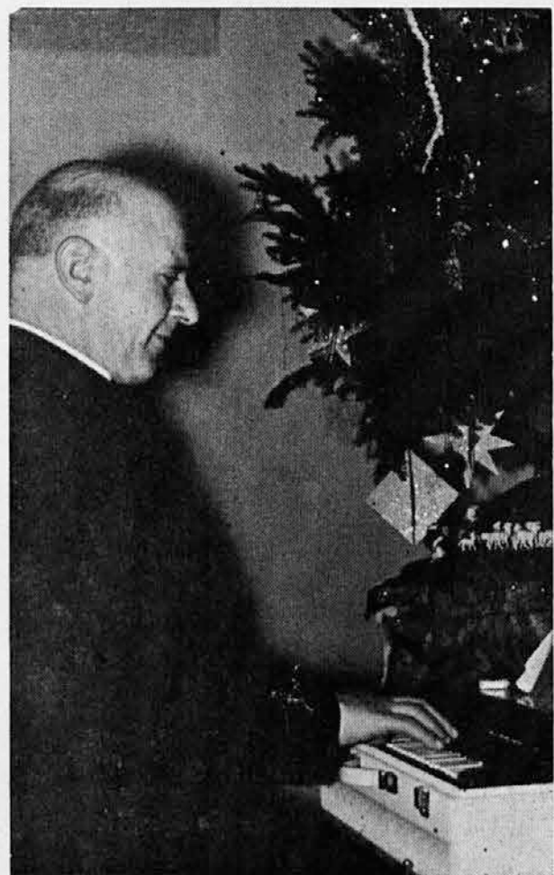
Veliki organizator ter neutrudni kulturni delavec