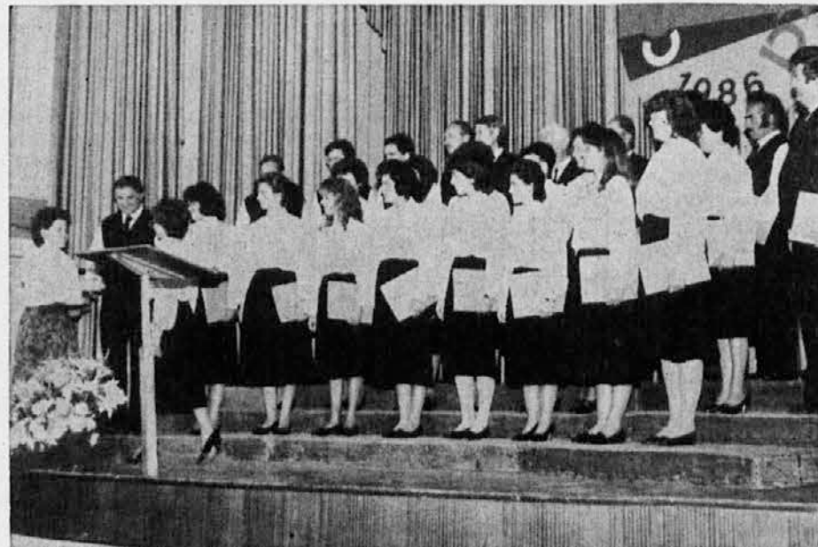
Mešani pevski zbor Standrež na Cecilijanki 1986