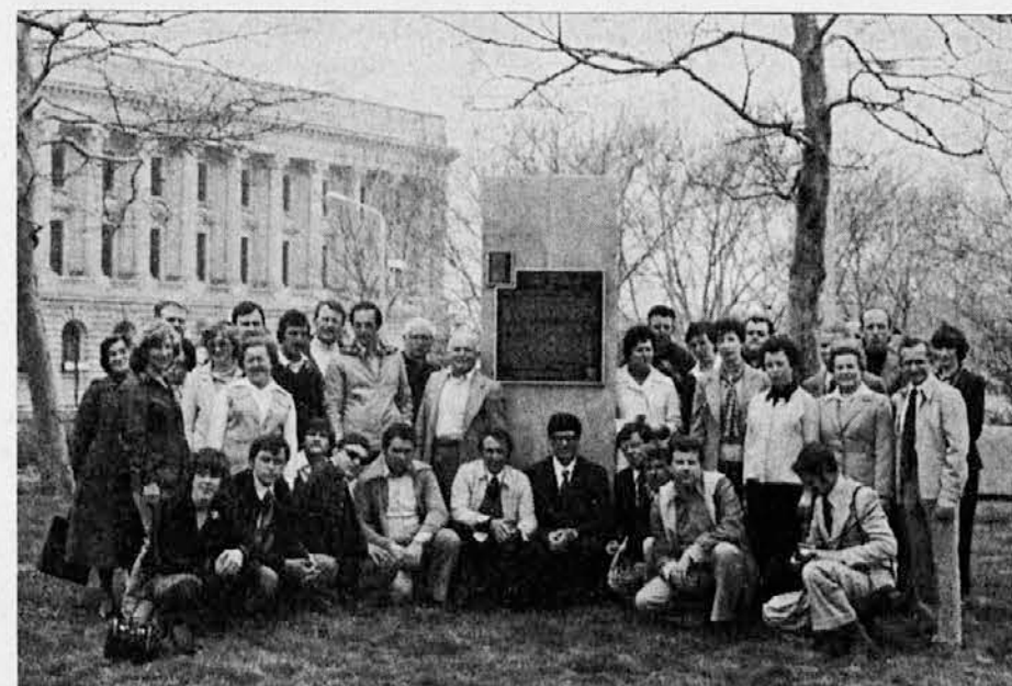
Od gostovanj je gotovo ostala v najlepšem spominu kulturna turneja po ZDA. Na sliki iz leta 1979 skupina Goričanov in gostiteljev v Clevelandu