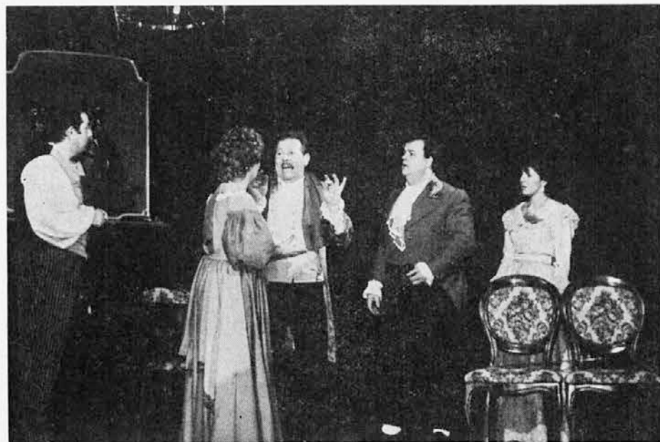
Najbolj aktivna dramska skupina je v Standrežu. Letos slavi 25-letnico neprekinjenega delovanja. Prizor iz komedije »Barillonova poroka«, ki so jo člani PD »Standrež« uprizorili leta 1986