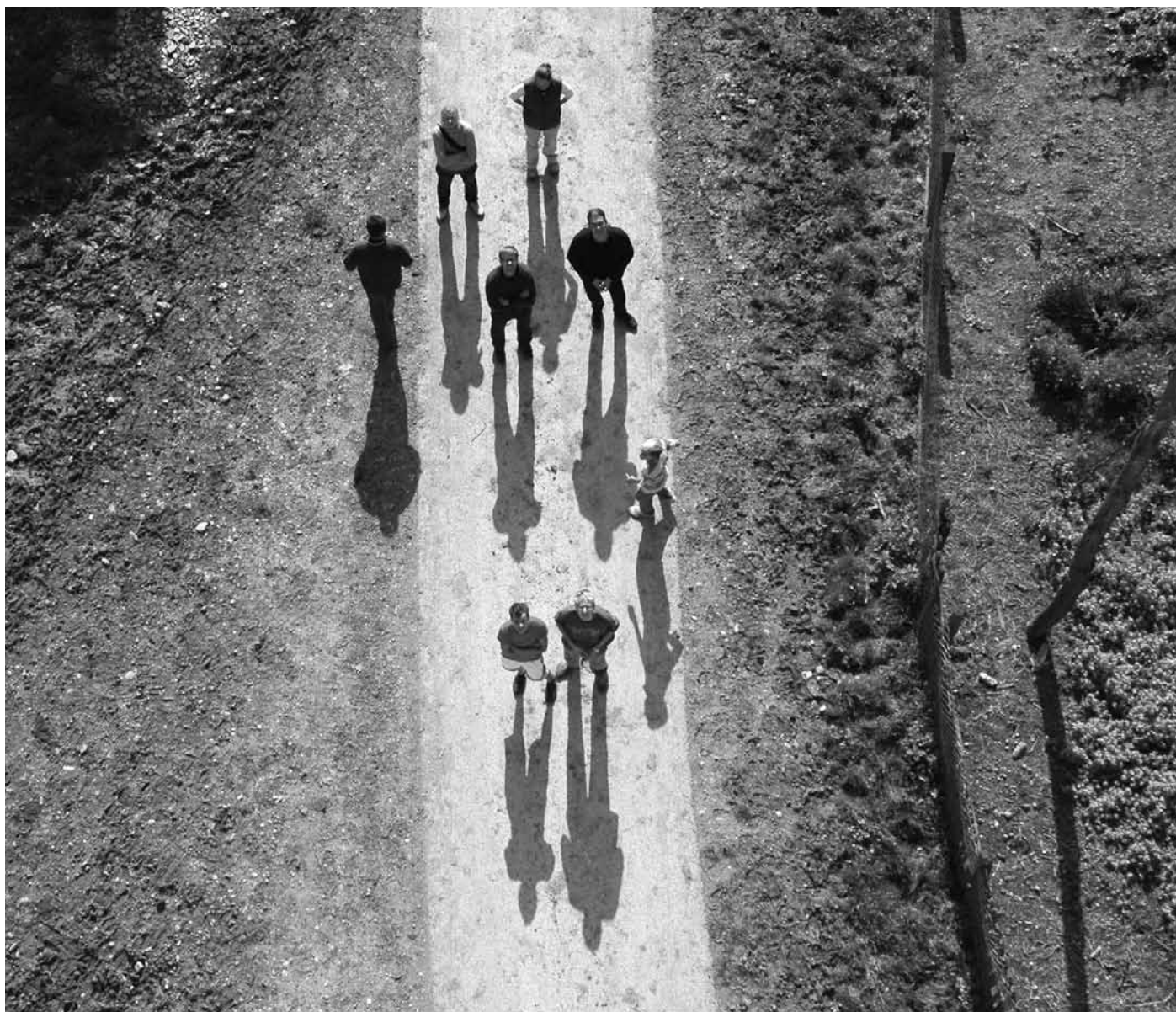
Slika 5: Pogled na udeležence delavnice, Šetarova [Domen Zupančič].