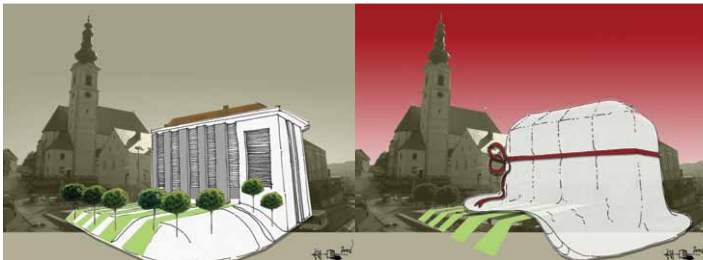
Slika 4: Skica predloga ureditve mestnega trga in nov fasadni ovoj hiše [Domen Zupančič].