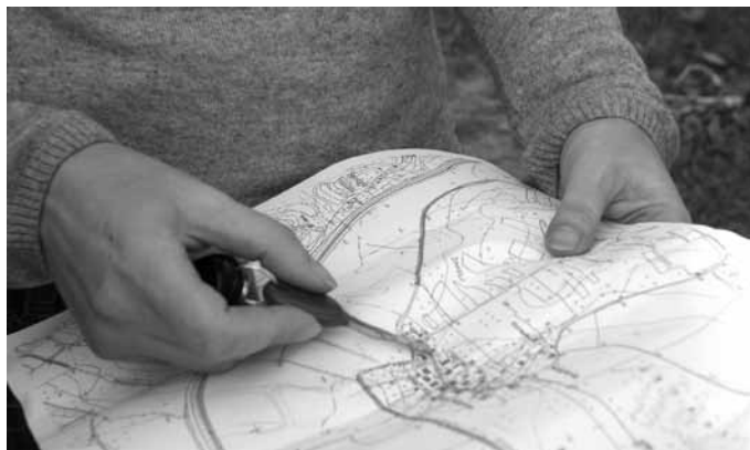
Slika 3: Detalj s terenski vaj.