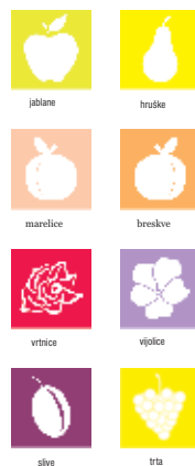
Predlogi zasaditve vrstov:

Potrebno je ohraniti estetsko in funkcionalno vrednost vasi, referenčne oblike in naravni del vasi ter skupni pašnik Gmajna.