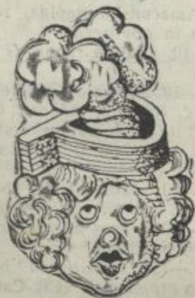
Te klobučke kaj rade nosijo mlade ljubljanske promenadnice, idejo zanj so dobile pri sladole- darju