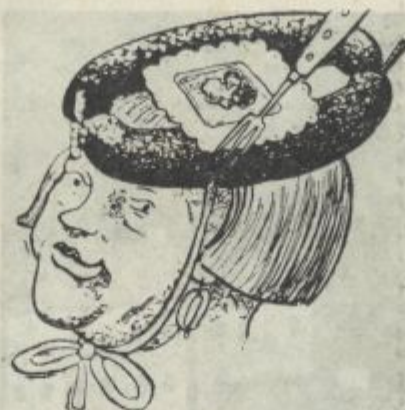
Imitacija suhe kranjske klobase Slovenska posebnost