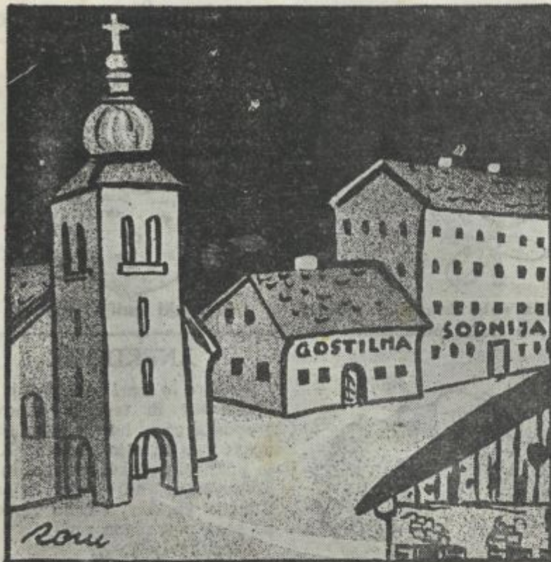
Slovenec ljubi hiš'ce tu...