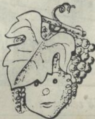
Simboličen klobuk iz Slovenskih goric, opažen na ljubljanskem velesejmu