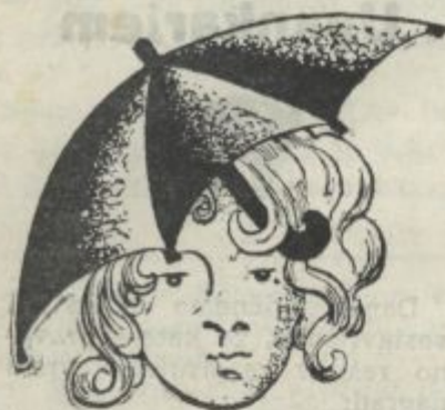
Angleški klobuk Izdeluje tvrdka München