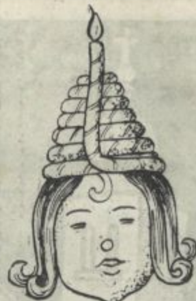
Evropski mrliški klobuk