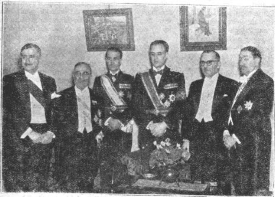
Z zasedanja sveta Balkanske zveze v Beogradu