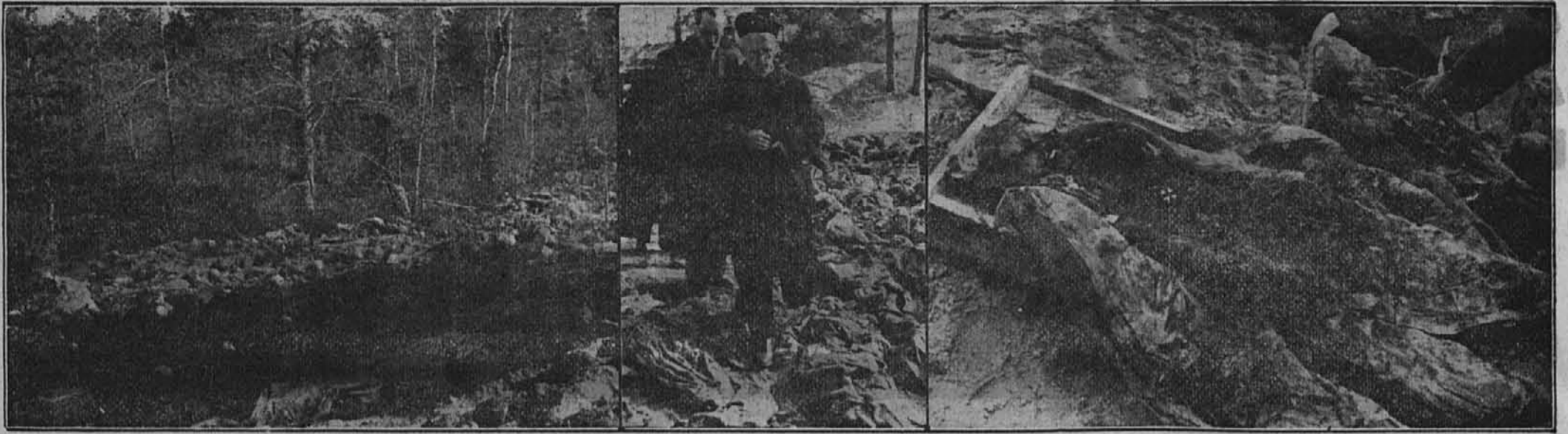
Katinski gozd groze!

Tukaj je umorila na najgrozovitejši način GPU 12.000 bivših poljskih častnikov. Slika kaže na kak živinski način so bila svojevotjno nametana, deloma samo nekaj centimetrov globoko zagrebena trupla poljskih častnikov drugo vrh drugega.