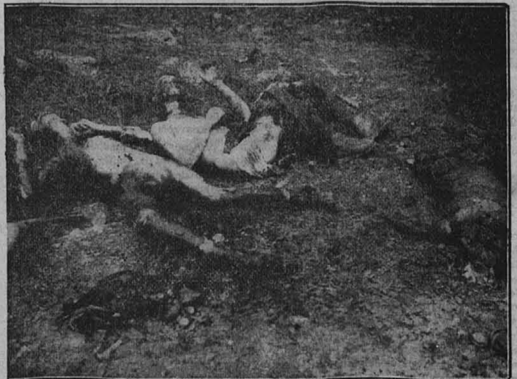
Slika za mnoge Morliške tolpe »osvobodilne fronte« na Gorenjskem so opravile svoje delo.