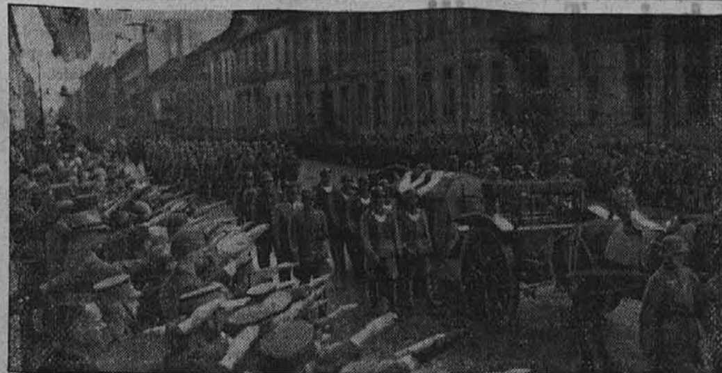
Slovo od Stabschefa Lutzeja

V prostoru južno od Bizerte je sovražnik poslal nove, daleko močnejše in po močnih skupinah zračnega orožja podprte sile oklopnjakov na naše tam do zadnje patrone bojujoče se čete. Ko je bila postreljena