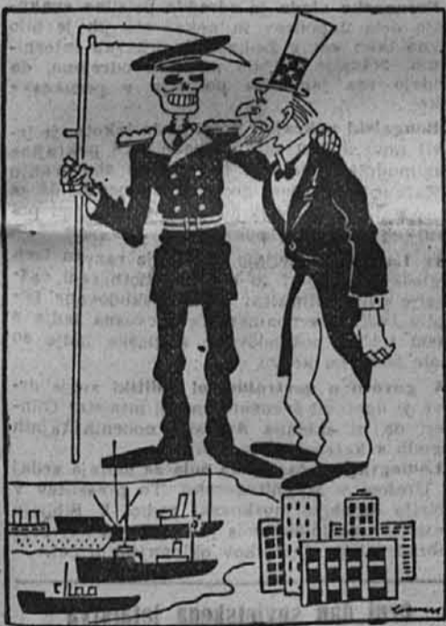
Čemu skrbi, striček Sam — za vsak primer prevzamem konvoj jaz. (Lehnert, Zander-M.)

V zračnih bojih in po obrambi protiletalskega topništva smo včeraj sestrelili 41 sovjetskih letal; mi pogrešamo štiri lastna letala.