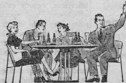
Be sure and watch the great new TV show "DAMON RUNYON THEATRE"—see your paper for time and station

To je vrednost, ki jo ima samo budjevoviško pivo —Budweiser