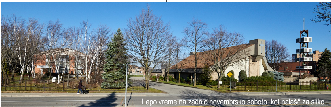
Lepo vreme na zadnjo novembrsko soboto, kot nalašč za sliko.