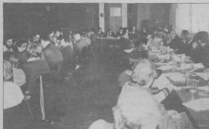
Pogovora s predstavnikoma CK ZKS, skupščine SRS, IS skupščine SRS in gospodarske zbornice SRS so se udeležili številni člani ZK in vodilni delavci Gradisa