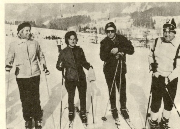
Ob koncu tekmovanja še posnetek za spomin ...