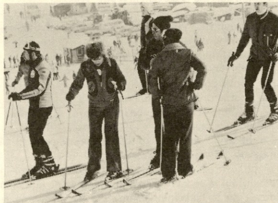
Prvi komentari po uspešnem prihodu skozi cilj ...