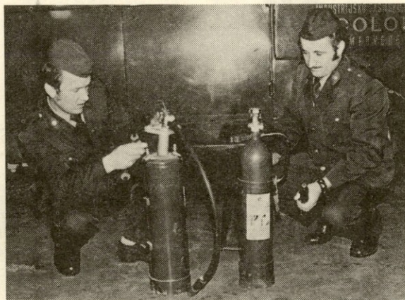
Naši prizadevni gasilci sami polnijo gasilske aparate ...