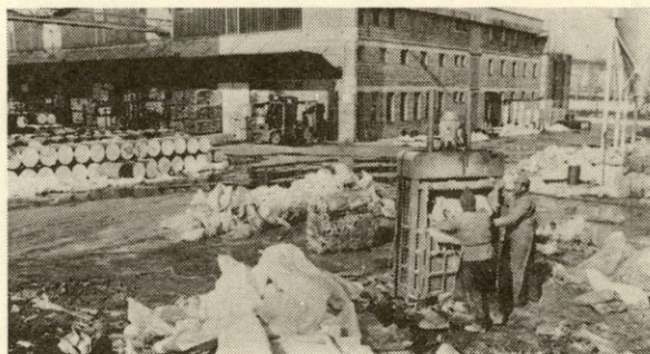
Pakiranje odpadnih vreč, katere prevzema Dinos ...