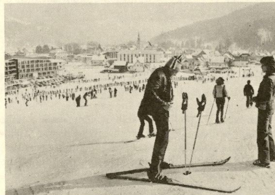
Kljub lepemu sončnemu vremenu se je nekaterih držala smola ...