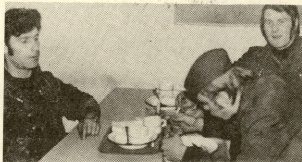
Detajl iz jedilnice v novi tovarni ...