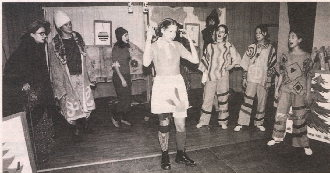
PREMIERA V BILČOVSVU