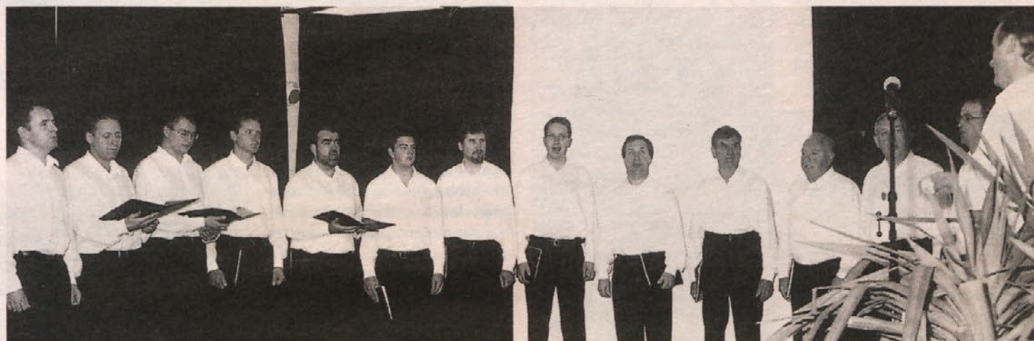
Moški pevski zbor »Trta« iz Žitare vasi v sedanjem sestavu

»Trta« je vseskozi gojila prijateljske in delovne stike s sosed-