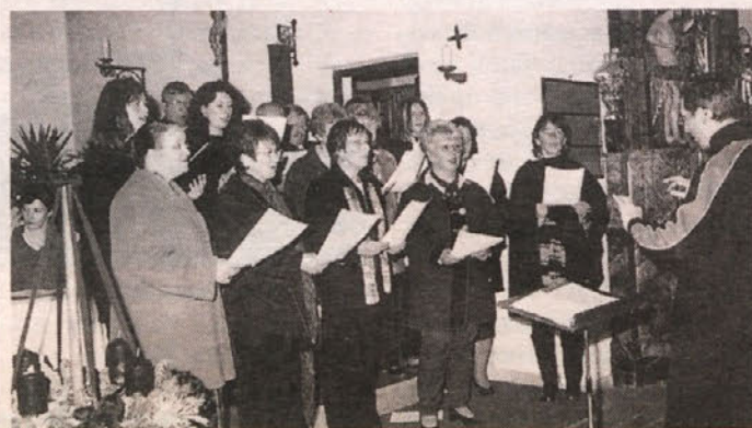
Boroveljski slovenski cerkveni zbor na adventnem koncertu