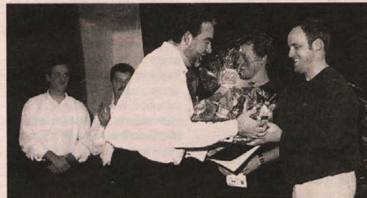
Izraz tesnega sodelovanja so bile čestitke predstavnikov MePZ »Danica« iz Šentprimoža.

Pozval ga je, da naj tudi v tem vprašanju zastopa vse občane in da krajevna imena in krajevne napise sprejme kot dragoceno kulturno dediščino dvojezične občine, v kateri občani drug drugemu in na vidnem mestu priznavajo krajevna imena v njihovem jeziku. Upoštevati je treba, da je bila pred 80 leti občina skoraj izključno enoje-