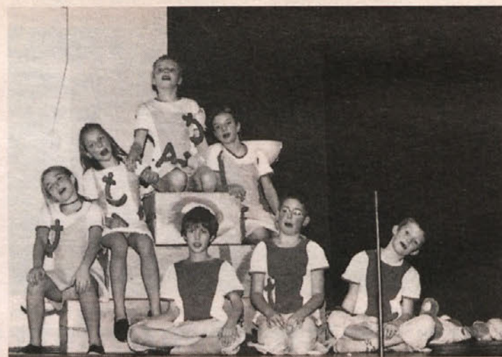
Sproščeni »Zarčki« na odru v Železni Kapli