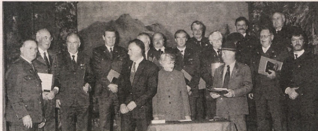
Odlikovanci družno na Cingelčevem odru