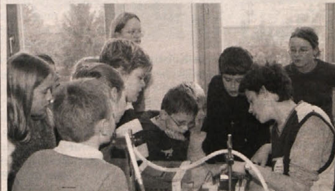
Mladi gostje so napeto spremljali fizikalne poskuse v laboratoriju