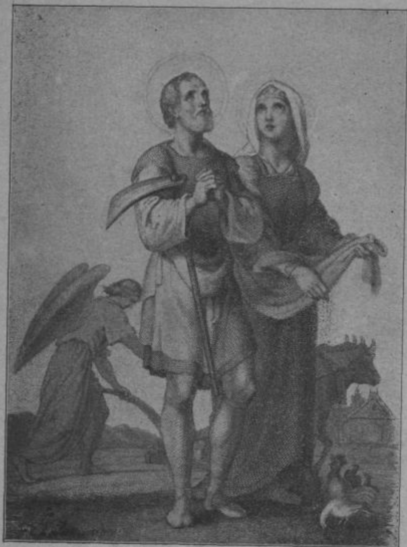
Svėti Izidor, patron poledelavcov z svojov svetov tovarišicov. V ozadji se vidi angel, ki plüži mesto svetnika, kda je té poleg Bože vole mogo Jezüša v najsvetejšem oltarskom Svestvi moliti. God sv. Izidora se obhaja Maja 15-ga.