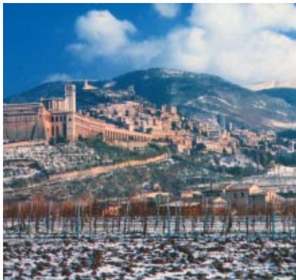
Tudi Assisi je sedaj prekrit z rahlo snežno kopreno.