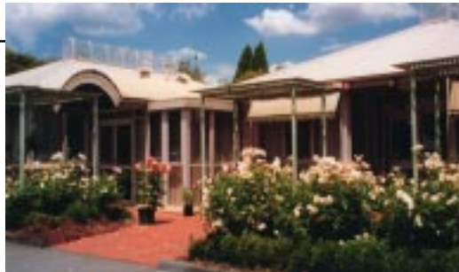
MOTHER ROMANA HOME Slovenian Hostel for the Aged Phone: 03 9853 1054 Fax: 03 9855 0811

Dom počitka matere Romane je slovenska ustanova, ki nudi bivanje v domačem okolju ostarelim in vsem, ki potrebujejo nego. Prijazna in topla soba, domača hrana, vesela družba, popolna zdravniška nega in celotna oskrba je samo del tega, kar boste našli v domu počitka le 20 metrov od slovenske cerkve v Kew.