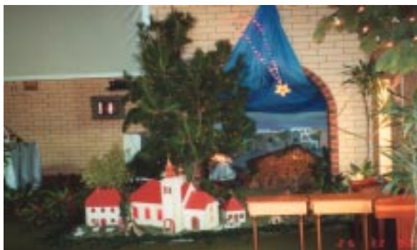
Slovenske jaslice v Adelaidi 2002.

danes vabim, da se udeležite zahvalne slovesnosti ob 20. obletnici blagoslova naše cerkve. Povabite svoje otroke, ki so danes že odrasli in imajo svoje