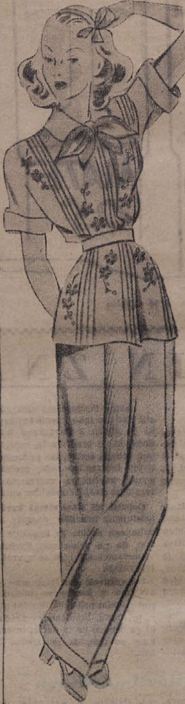
S preprosto vzetim vzorcem močno pozitiviz plazmo