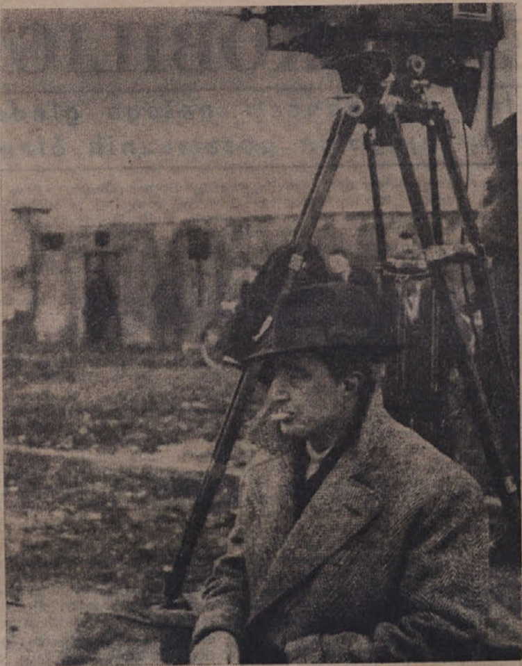
Znani italijanski režiser De Sica pri delu.

Začetnik avangardističnega surealističnega ali abstraktnega filma, ki je cvetel od 1. 1920-1930 je bil slikar Viking Egeling; prvi pravi režiser te vrste filmov pa je bil Fishingier, ki je izdeloval predvsem znanstvene in glasbene filme. Ustvarjal je kratke filme, nekake grafične predstave glasbenih utripov. Prikazati je namreč hotel odnos med glasbo in risbo, kar se mu je v veliki meri posrečilo. Mnogo let za njim je izdelal Disney film «Fantazija», toda ni dosegel Fishingierja.