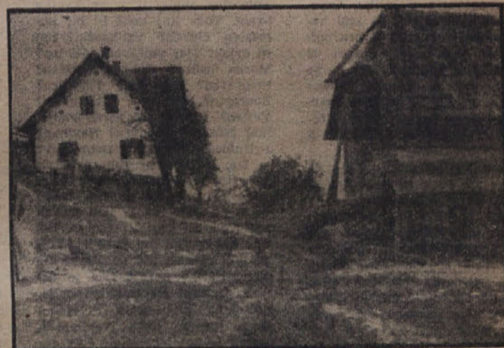
«Prežihovinas» v Kolljah, kjer je Prežihov zadnja leta živel in delal