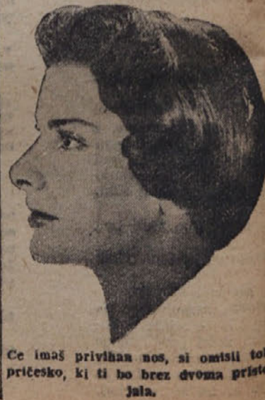
Ce imaš privihnan nos, si omlisi tole pričekso, ki ti bo brez dvoma pristojala.

ure, nato jih kakor običajno razreži na listke. Vzemij kožico, pokrij dno z eno vrsto prekajene slanice, polagaj nanjo rezine korenja, sesekljane peteršilja, kak listič materine dušice in lovorja, 2 nageljnovi žbici in strok česna: pokrij nato z vrsto vampov. Tako delaj, dokler ne napolniš posode, zadnja vrsta naj bo spet iz slanice. Polji s pol kozarca juhe, dobro pokrij s pokrovom in peci v pečici do 3 ure. Ponudi še toplo.