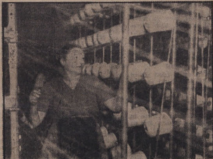
Udaralca pri stroju v Mariborski tekstilni tovarni

Vlak je brzel s hitrostjo 120 km na uro ob Dravi med Pohorjem in Kozjakom mimo Mariborskih železniških delavnic, tovarne dušika in karbida v Rušah, zaustavil se je nad veliko elektrarno Fale, ki z hi-