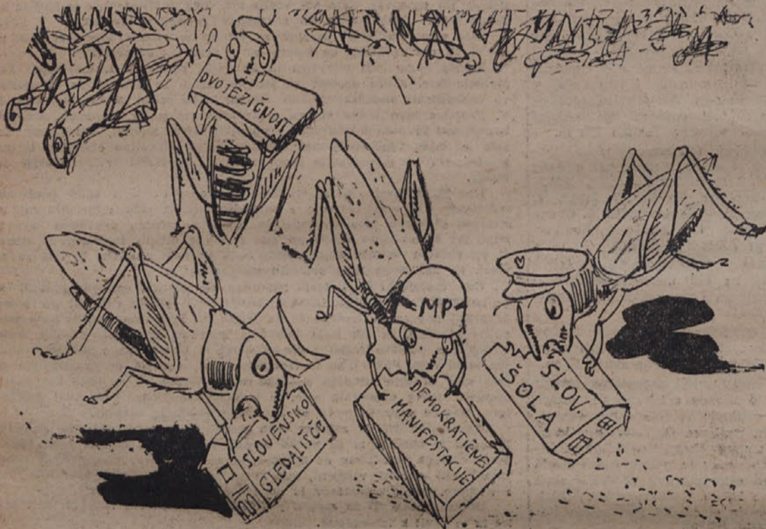
Kobilice na angloameriškem področju STO-ja.

Angloameriška vojaška uprava je preko svojih policijskih organov prepovedala predvajanje ameriške drame «Kobilice» na Kontovlju, ki je sedaj na repertoarju Slovenskega narodnega gledališča v Trstu. V drami «Kobilice» je prikazano, kako ameriški kapitalisti izkoriščajo črne in kako se z plen žro med sedoj. Prireditev pa so prejevali por izgovorom, da dvorana na Kontovlju ni «kolavdirana»