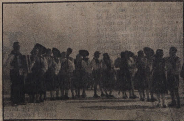
Folklorna skupina SKUD-a «Prežihov Voranc» iz Guštanja, ki je s skupino «Tine Rožanc» iz Ljubljane na republiškem tekmovalju zasedla prvo mesto na gostovanju po Dalmaciji

Železničarsko Sindikalno kulturno umetniško društvo «An-