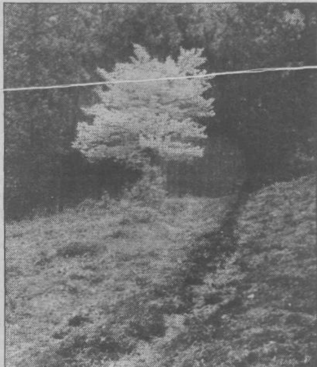
Ko bukev na poseki v mladem zelenju zagori, gozdar in vsak ljubitelj lepote postoj...