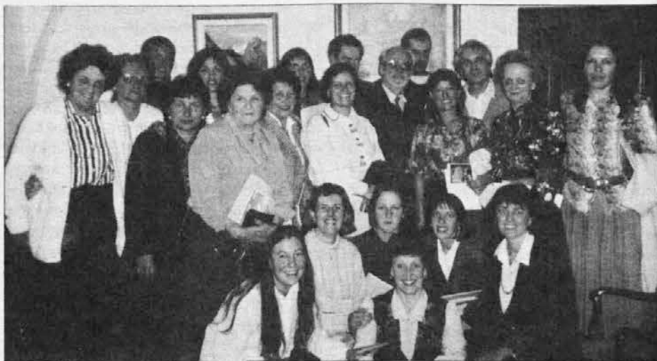
Večer s pesnikoma Tonetom Pavčkom in Tonetom Kuntnerjem.