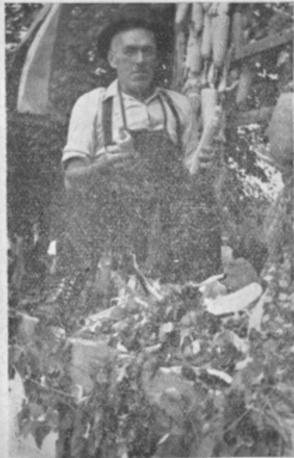
Zadružniki so na paradi pokazali svoje delo. Med najbolj zanimive prikaze sodi revija štirih letnih časov na vasi. Tole je brez dvoma detajl iz jeseni

Leta 1941, ko je domala vsa Evropa ležala v prahu pod nacističnimi škornji, tudi tu, kot po vsej širni domovini ljudje niso upognili hrbtov. 22. julija, na dan, ki ga praznujemo kot praznik vstaje slovenskega naroda, so na teh tleh skupaj z Zabukovčani ustanovili prvo Savinjsko četo. Boj, ki so ga oni začeli, ni prenehal, dokler ni bil izgnan sovražnik, dokler niso bile porušene vse krivice preteklosti, dokler se ni uresničila želja upornega ljudstva in dozorela v seme, ki so ga sejal preboldski revolucionarji s Slandri