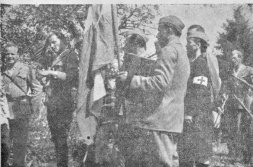
Na partizanskem mitingu na Slemenih nad Dramljami so se srečali stari znanci iz partizanskih let.

V soboto, 21. julija zvečer so množične organizacije Ljubecne v počastitev Dneva vstaje slovenskega ljudstva priredile lepo proslavo pred spominsko ploščo padlim borcem tega kraja pri gasilskem domu. Na sporedu je bil kratak govor, recitacije, igrala pa je tudi godba na pihala. Na koncu so predstavnik Socialistične zveze Ljubecne, kolektiva Opekarne Ljubecna-Bukovžlak ter SZ Začreta, Leskova in Zepine položili pred spominsko ploščo vence.