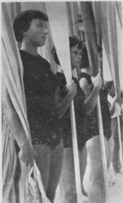
Iz njih veje mladost, zdravje in predanost domovini

Ves teden je bilo v Preboldu živahno. Vse dni so se vrstile prireditve, na katerih so sodelovala vsa tamošnja društva in množične organizacije. Zadnji dan, na dan dveh praznikov, je bil dobesedno ves Prebold z okoliškimi vasmi vred na nogah. — To je bila vrhunska prireditev dneva, veličasten zaključek in pregled političnega, kulturnega in