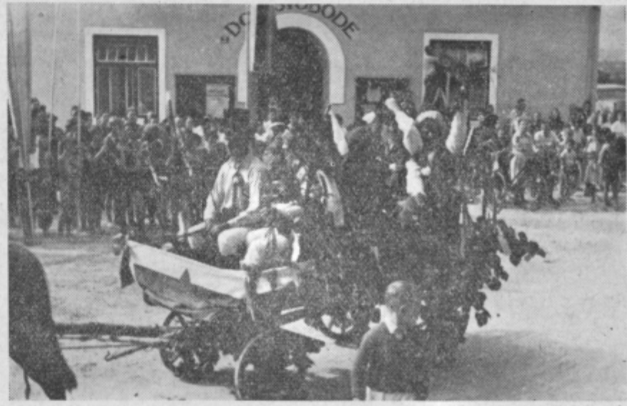
Cut za tradicijo je v kmečkih ljudeh še vedno živ. Tu vidimo veselo kmečko »ohcet« v originalnih slovenskih nošah

Skratka, ves Prebold z okolico, vse gospodarske panoge, vse politično, kulturno in telesnovzgojno življenje se je v tem času pomikalo mimo oči prisotnih gledalcev. Toda gledalci so bili so-