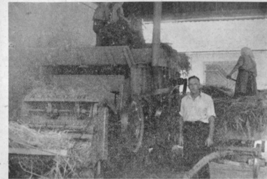
Dan prej v paradi, naslednji dan pa že ob mlatilnici. Prvi na sliki predsednik zadruga Prebold.

»Prihodnji prvi maj v Preboldu ne bomo več slavili v tovarni«, je dejal direktor tovarne in predsednik društva