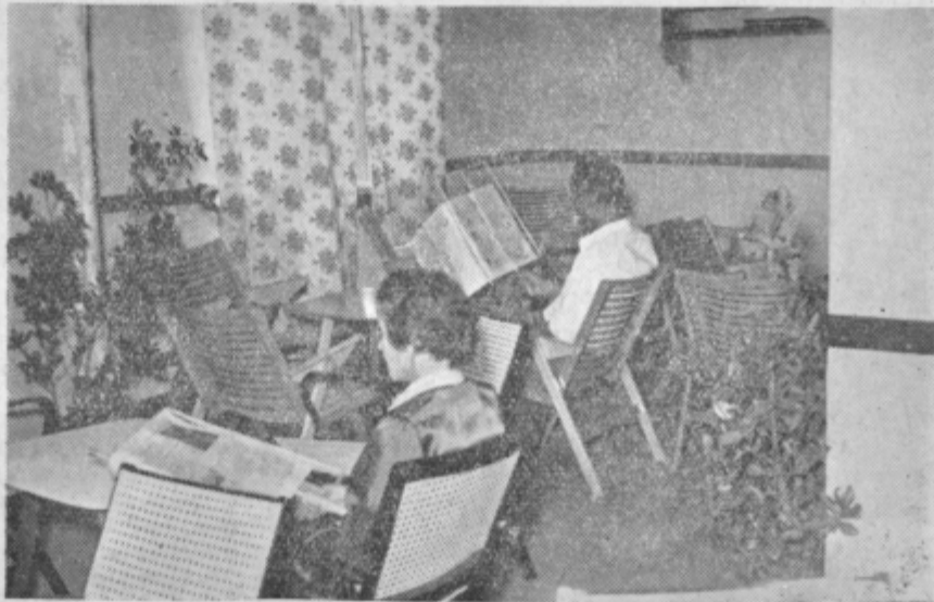
Po končani paradi so v domu »Svobode« odprli novo čitalnico in knjižnico, ki bo duhovno središče življenja v tem kraju

Z velikimi uspehi je Prebold z okolico proslavil slavnostne dni. V teh skromnih vrsticah ni bilo mogoče povedati vsega, kar bi bilo treba povedati. Prebold je na poti naglega napredka, občani tega kraja stopajo pod enotno zastavo svojji boljši bodočnosti naproti. Veliko je še starega, toda te stvari so mrtve in debelo zidovje graščine je simbol tega minulega časa. Novi pa so ljudje, prežeti z novim časom. In to je poglavito. Ziva človeška volja, njegova zavest in hotenje spreminjajo čas, odnose, okolje in zgodovino. Vse ostalo je minljivo. Po tolikih borbah, žrtvah in prizadevanjih Prebold z okolico slavi največkratnejšo zmago in polnokrvno življenje in piše najpomembnejše poglavje svoje zgodovine v okviru velike družine jugoslovanskih narodov.