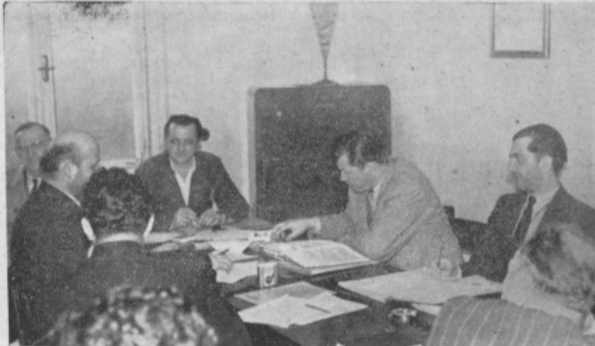
Kot v zadrugi, tako tudi v tovarni odločajo o vsem življenju kraja delovni ljudje. Na sliki zasedanje delavskega sveta v Tekstilni tovarni Prebold.

delujoči, sodelujoči gledalci. Prav gotovo so bile preboldske hiše in okoliške vasi v teh urah prazne.