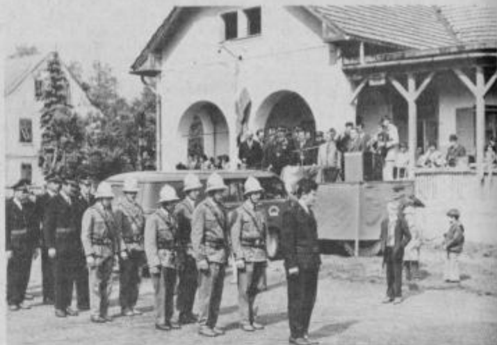
Prevzem novega gasilskega avtomobila v Središču

Minulo nedeljo so središki gasilci prejeli v uporabo nov gasilski avtomobil znamke IMV. S to novo pridobitvijo so končali nabavo gasilske tehnike, saj so lansko leto dobili novo motorno brizgalno in nove cevi. Tako je sedaj društvo opremljeno v celoti.