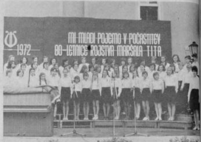
Z nedeljskega nastopa

Za tem so se najprej zvrstili štiri otroški zbori, Glasbena šola otroškimi orkestrom in pevskimi zborom, OŠ Ivana Spolenjaka harmonikarskim orkestrom, osnovna šola Hajdina in Toneta Žnidaršiča s pevskimi zbori.