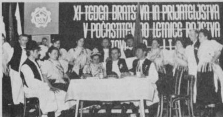
Člani orkestra Ogranak seljačke sloge Prelog ob svojem nastopu v Majšperku.