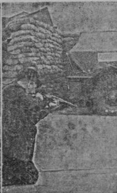
Angleži so iznašli avtomobilsko gumijaste obroče, katerih ne prebije krogla iz puške