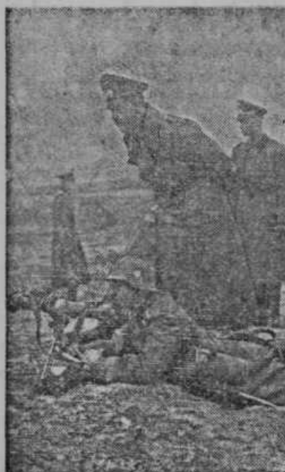
Generaloberst Brauchitsch, vrhovni poveljnik nemške armade, na fronti

Nakup polovice posestva — plačilo dolgov. O. A. Predvsem Vas opozarjamo, da je treba pisma opremiti z znamko za 1.50 din in ne samo za 1 din. V ostalem Vašega pisma, čeprav je zelo obširno, nismo točno razumeli. Ako ste sklenili običajno kupoprodajno pogodbo glede polovice posestva, tedaj ste dolžni plačati le dogovorjeno kupnino. V to kupnino se lahko vračuna, odnosno odračunajo eventualni prodajalčevi dolgovi, katere bi Vi prevzeli v svojo plačilno obvezo. Zlasti velja to, ako bi bilo kupljeno posestvo obremenjeno s hipotekami in bi prodajalec ne oskrbel bremen prostega odpisa prodane polovice, odnosno zbrisa hipotek. — Kaj drugega bi veljalo, ako je prodajalec prodal polovico posestva z namenom, oškodovati svoje upnike, namreč, da bi kasiral kupnino ter jo zapravljal ali skrnil, upniki pa bi mu ne mogli do živlega, ker ne bi imel več posestva. Ako bi Vi vedeli za tak oškodovalni namen, bi oškodovani upniki smeli od Vas tirati to, kar so radi prodaje izgubili, in bi morali Vi s kupljeno polovico posestva jamčiti za škodo upnikov, čeprav ste kupnino izplačali prodajalcu. Ako bi bili Vi bližnji sorodnik prodajalca, bi morali Vi dokazati, da Vam ob nakupu posestva dolgovi prodajalčevi niso bili niti znani,