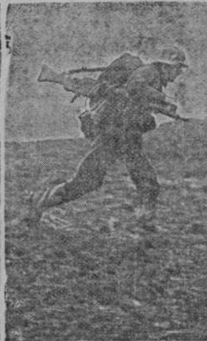
Nemški vojak se pripravlja in vežba za frontno službo. Ima novo nemško avtomatično puško