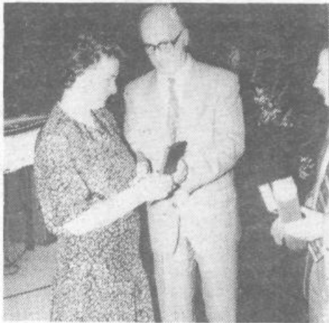
Na slavnostni akademiji so med drugim podelili tudi več priznanj

Pa se je kramljanje mladega omizja na odru o Zavodu na lepem prevesilo v pravo skeč, kjer so po vrsti vznikli »šahovski mojstri« (za pravo šahovnico) »košarkaš« z žogo, nekdo je