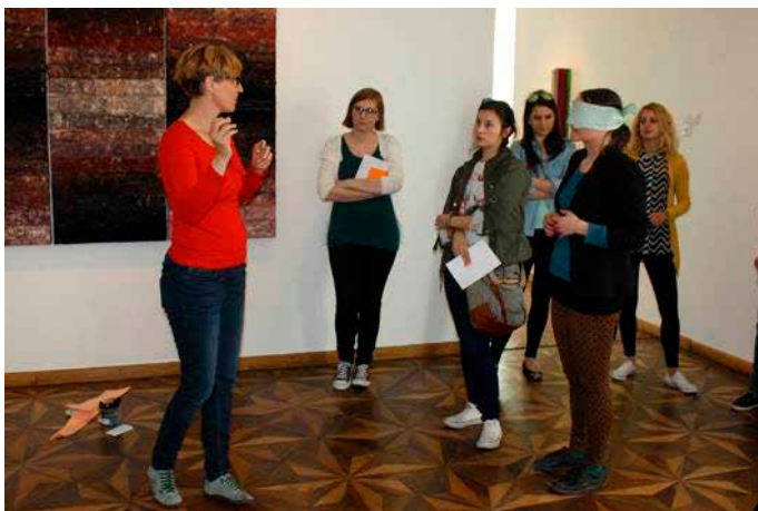
Slika 2: Interakcija med kustosinjo in slepo osebo pri spoznavanju umetniškega dela

doživljanju. Z nalogo smo udeležence spodbujali v aktivno gledanje in razmišljanje o umetnini, to pa je tudi dodatna spodbuda slabovidnim, da uporabljajo ostanek vida. Udeleženci igre ponujajo različne odgovore, na kaj jih delo spominja, kakšne občutke jim vzbuja itd. Predstavlja njihov osebni odziv na umetnino, zato običajno dobimo toliko različnih asociacij, kolikor je udeležencev. Raznolikost asociacij omogoča vživljanje v pogled drugega in hkrati večplastno gledanje in spoznavanje umetnine – in prav to je bilo izhodišče za naše nadaljnje delo. Vloga muzejskega pedagoga je bila, da vodi pogovor – zbira asociacije, postavlja vprašanja, udeležence spodbuja v pojasnjevanje asociacij, v vživljanje asociacij drugih ... V pogovor smo vključili tudi osebe brez ostanka vida, da bi »perspektiva videnja« (Duh in Zupančič 2011, 49) videčih udeležencev stopnjevala doživetje tudi pri njih. Predvidevali smo, da se bodo slepi in slabovidni na podlagi pogovora o asociacijah približali vsebini abstraktnega dela, poglobili razumevanje slike in jo na svoj način doživeli.