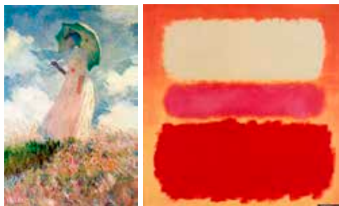
Slika 1: Andy Warhol: Brillo Soap Pads (1964–1969), Woman with a Parasol (1886), Mark Rothko: White Cloud Over Purple (1957)

De Coster in Loots (2004) menita, da je vizualna intenzivnost v teh delih zelo različna in le ustrezen likovnopedagoški pristop to različnost pri delu s slepimi in slabovidnimi osebami tudi upošteva.