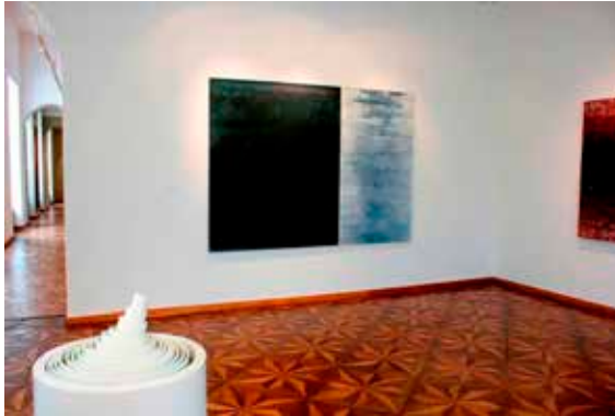
Slika 3: Slika Marjana Gumilarja, Par (1999)

Rezultat je bil presenetljiv. Osebe, ki so imele zavezane oči in so potem sliko lahko pogledale, so potrdile, da so s pomočjo asociacij in pogovora dobile dokaj realen vtis o sliki. Svojo predstavo o sliki je podala tudi slepa oseba: naštevala je asociacije, spomine in občutja, ki so se ji sprožale na osnovi pogovora, sliko pa je poskušala opisati (barve, oblike): »mislim, da je veliko temne barve ... da spominja na nekakšno pokrajino ...«