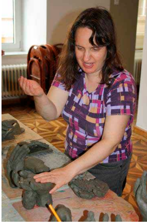
Slika 9: Slepa oseba pri vrednotenju nastalih kiparskih del