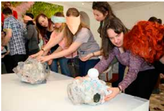
Slika 4: Spoznavanje umetniških objektov Alena Ožbolta

Podobno nalogo smo izvedli tudi pri predstavitvi del Alena Ožbolta, Waste Reactor (Consumer Goods, Consumer Bads) (odpadki, plastika, 2008) in Production – Refuse (odpadki, plastika, steklo, 2008), pri kateri smo slepim in slabovidnim omogočili tudi tipno izkušnjo, neposreden stik z umetnino.