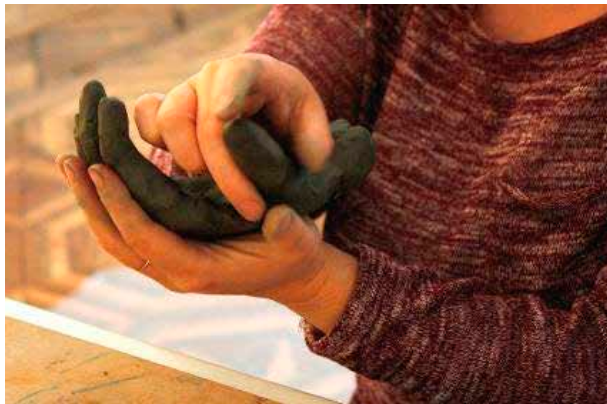
Slika 8: Slepa oseba pri oblikovanju kiparskega izdelka roke

Ogledu razstave je sledila likovna delavnica. Udeleženci so oblikovali roko kot svoj portret. Izbrali smo tehniko oblikovanja v glini. Večina je roko ustvarjala v naravni velikosti, pri tem so razmišljali o pomenu drže, možne deformacije, površine itd. Pri delu so si pomagali z opazovanjem oz. tipanjem lastne roke. Sodelujoča slepa oseba je že imela dovolj izkušenj z oblikovanjem z glino, zato je bila pri delu samostojna. Slabovidna oseba je v glini ustvarjala prvič in je pri delu potrebovala tehnično pomoč, vendar je bila dovolj samomotivirana in je imela veliko veselja do ustvarjanja.