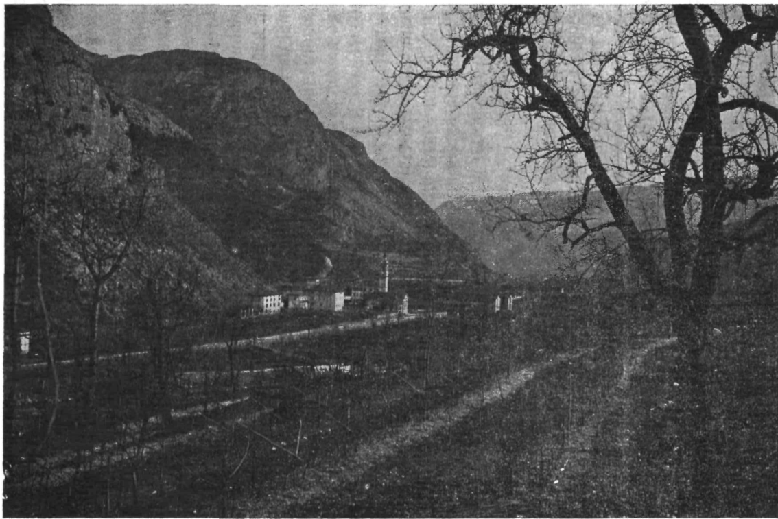
Tolmin, ob Soči