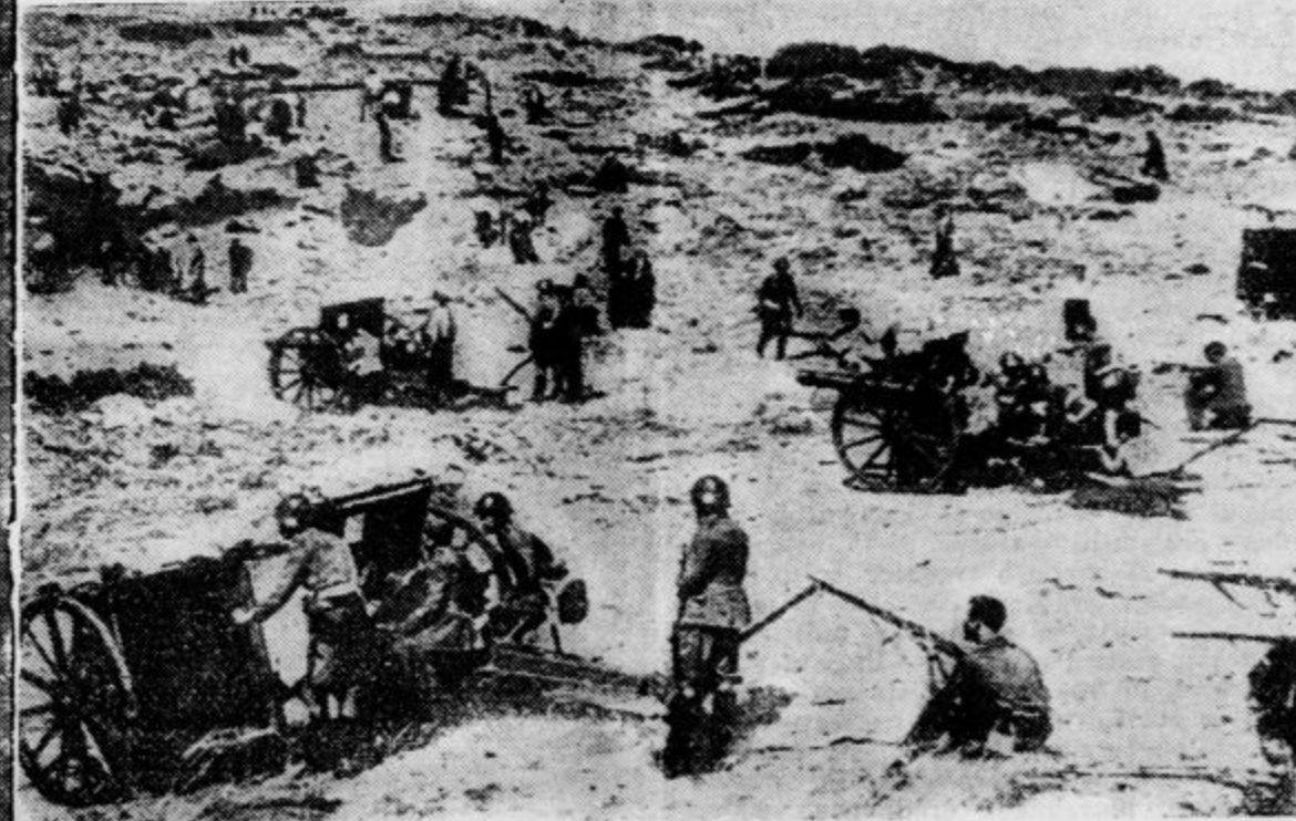
Uporniški topničarji v položajih gorovja Guadarrama