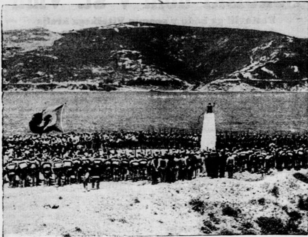
Na podlagi sklepa konference v Montreuxu so turške čete spet zasedle Dardanele