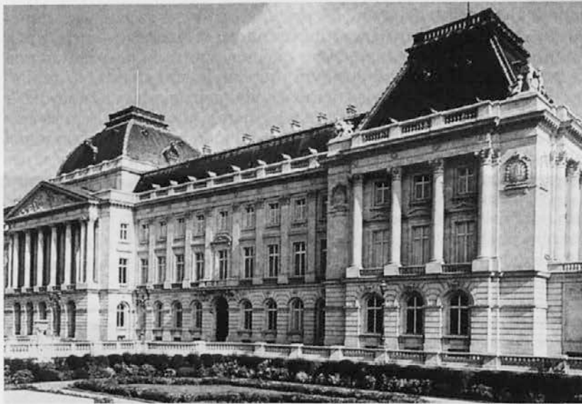
Sodna palača v Bruslju