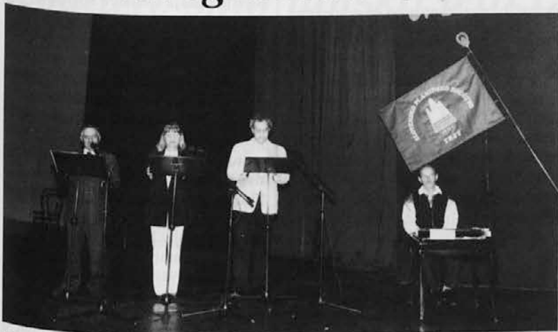
Recitatorji in citraš med nastopom na odru Kulturnega doma