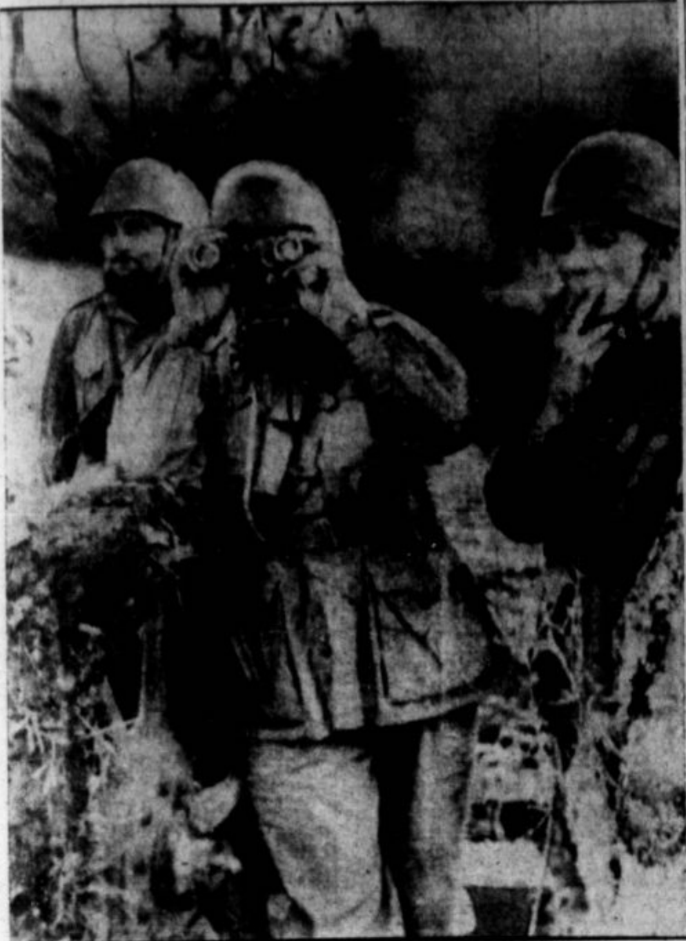
NEKAJ ITALIJANOV se le bori na zavezniški strani. Saj tako pravi vest, ki je bila poslana iz Italije z gornjo sliko. Predstavlja italijanske častnike, ki so se borili prej na nemški strani proti nam, sedaj pa so se obrnili proti prejšnjim zaveznikom.