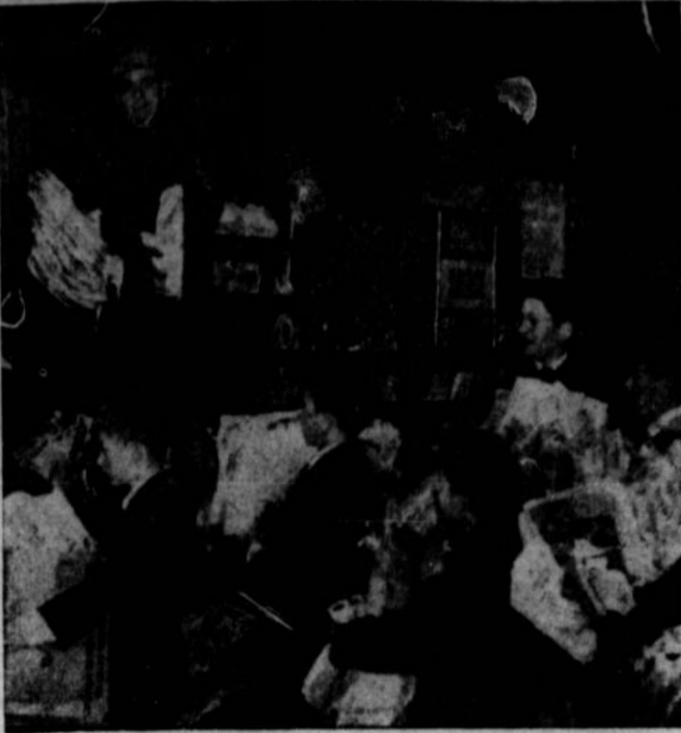
KAMPANJA ZA ZBIRANJE STAREGA PAPIRJA, pričeta v januarju, se nadaljuje. Iz starega papirja izdelujejo mnogo predmetov za armado in za civilno uporabo. Ker ga manjka, bo našim vojnim naporom zelo pomagano, če starega papirja ne uničite, nego ga izročite nabiralcem, ki ga pošiljajo v papirnice za v predelavo. Marsikje zbirajo star papir v vojne namene učenci, kakor jih predstavlja gornja slika.

Kadarkoli imate priložnost, nagovorite prijatelja ali znanca, da si naroči Proletarca.