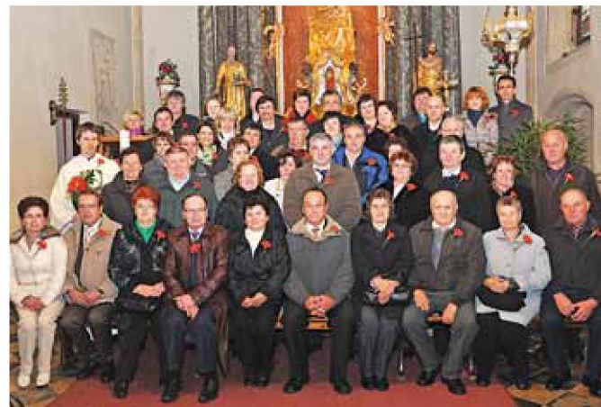
Zakonci jubilanti