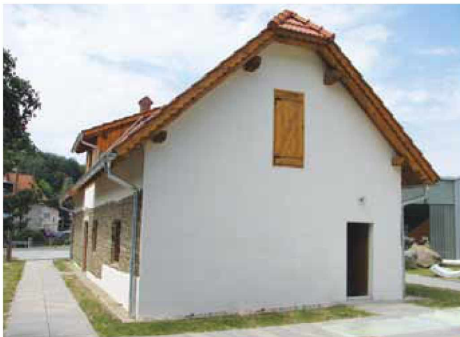
Obnovljena Lednarjeva usnjarna

Glede na zmožnosti in potrebe tistega časa je objekt postal pomembna postojanka skorajda slehernega kmeta domačina, ki je takrat rabil usnje. Kot primer: če tega ni imel oziroma si ga ni priskrbel, je bil bos, kajti čevljev drugače ni bilo moč kupiti oziroma dobiti. Ob glavnem