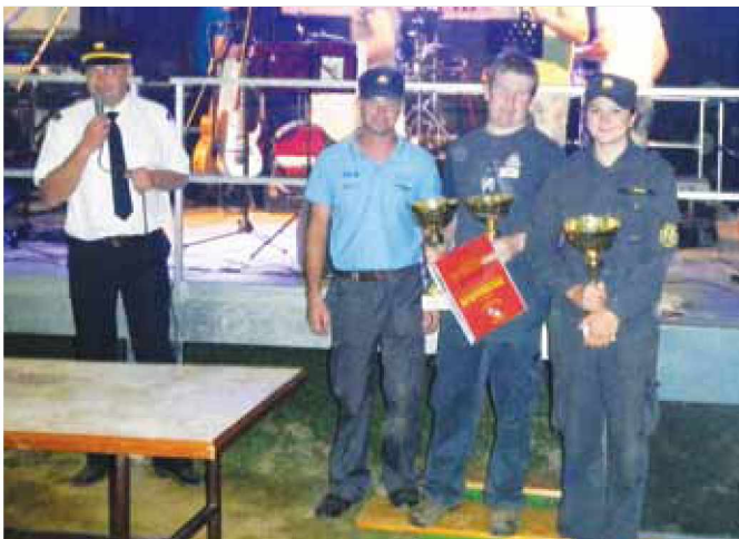
Zmagovalca PGD Motovilci in članice PGD Bodonci »A«