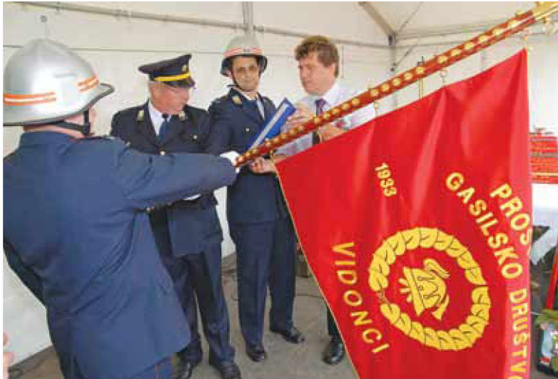
Razvitje prapora leta 2009

društva, ki skozi čas pridobiva muzejsko vrednost, zato je prapor del zgodovine, s katerim je potrebno ravnati spoštljivo.