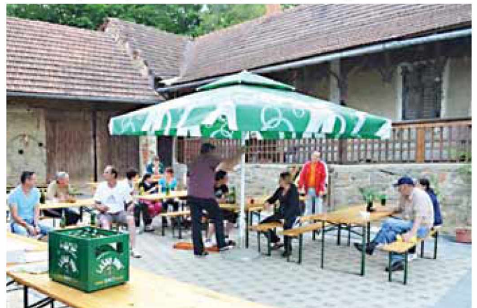
Prva postaja na pohodu po Dolnjih Slavecih

Tudi letos smo pohod speljali po hribih in dolinah domače vasi, kjer se je lahko vsak pohodnik nagledal lepot ter