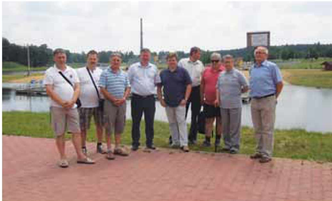
Predstavniki pobratenih občin ob Rekreacijskem centru v Bližynu