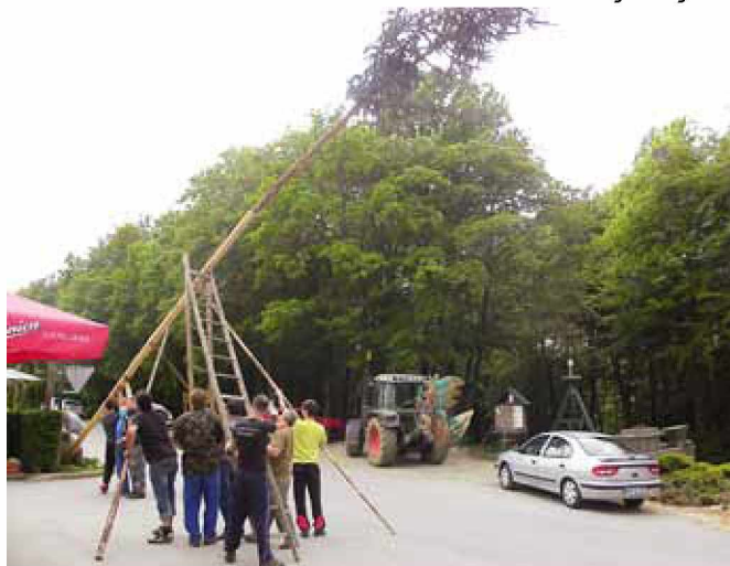
Postavitev mlaja v Kruplivaniku