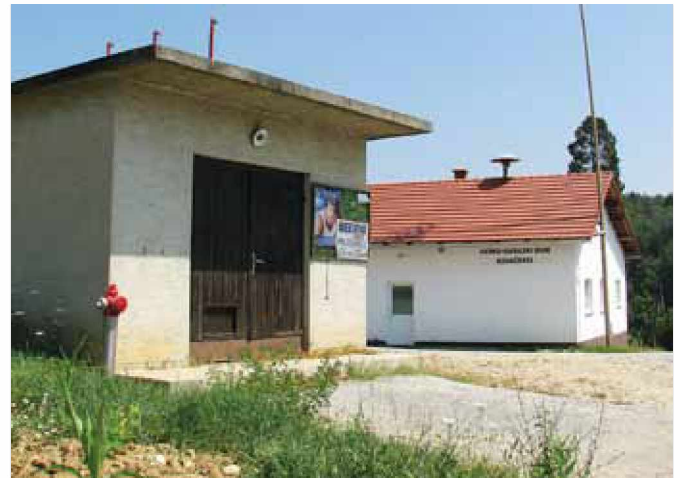
Hidrant ob Vaško-gasilskem domu v Kovačevcih