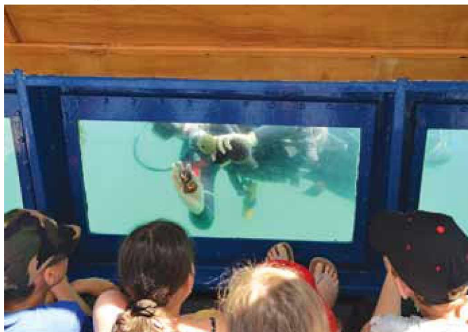
Podvodni svet je bil še posebej zanimiv