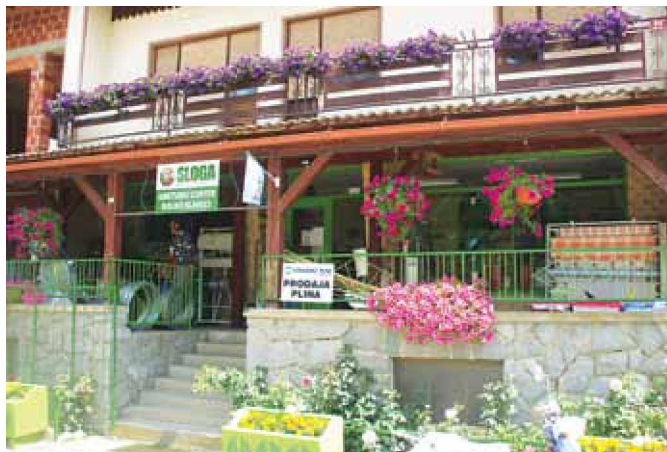
Trgovina Sloga z.o.o. na Dolnjih Slavečih

Trgovina ima 520 m 2 . Prodajnih prostorov je 70 m 2 , skladišče zavzema 300 m 2 , 150 m 2 pa je tudi na prostem. Ponudba trgovine je zelo obširna, vse od fitofarmacijskih sredstev (zaščitna sredstva), barv, lakov, orodij do raznih rezervnih delov (filtri, žarnice,...). Poleg omenjenega je ponudba velika tudi za kmetijsko mehanizacijo, prikolice,... KGZ Sloga z.o.o. je obširna predvsem z vso kmetijsko mehanizacijo proizvodov John Deere, kakor tudi vseh rezervnih delov omenjene znamke. Poleg znamke John Deere je trgovina zastopnik še za podjetje Kuhn, ki ravno tako nudi vso strojno kmetijsko mehanizacijo, Reisch, katera nudi vse vrste prikolic ter za Vogel & Noot, ki ima v svoji ponudbi ravno tako vso mehanizacijo. Poleg omenjenega trgovina nudi tudi veliko izbiro izdelkov iz galanterije (pijača,