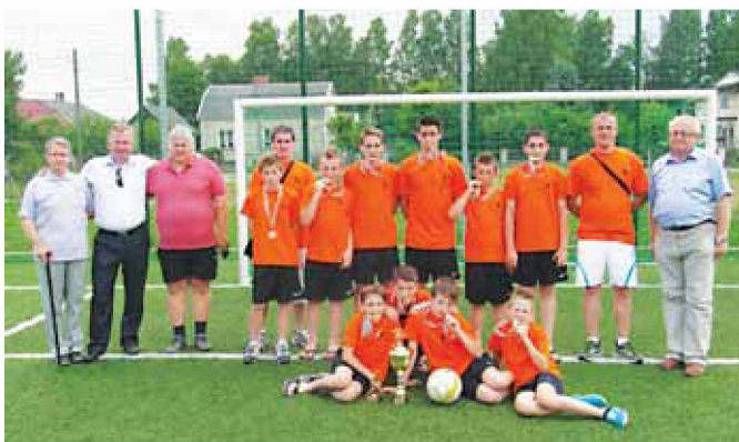
Zmagovalci turnirja NK Grad U-14