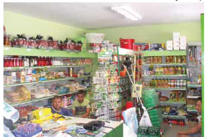
Trgovina je založena z raznovrstnim blagom