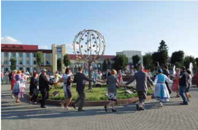
Praznovanje Občine Vilejka v Belorusiji