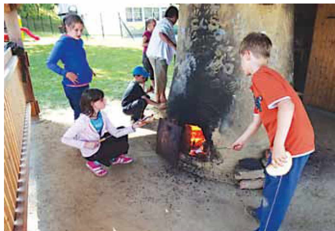
Lončarstvo na OŠ Grad je v polnem zamahu