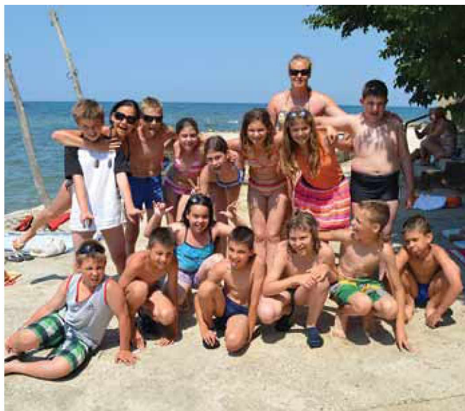
Pravi morski gusarji

Helena Poznič Kos, učiteljica razrednega pouka