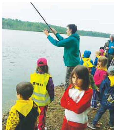
Ribarjenje ob jezeru v Kraščih