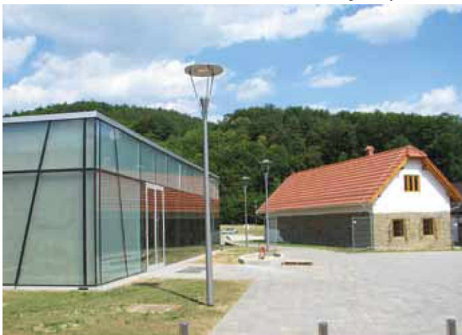
Doživljajski park Vulkanija dobiva svojo podobo