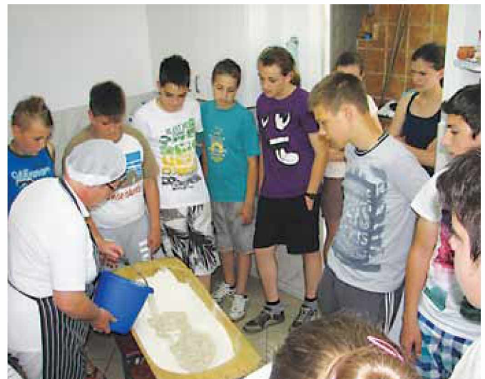
Na delavnici o peki kruha