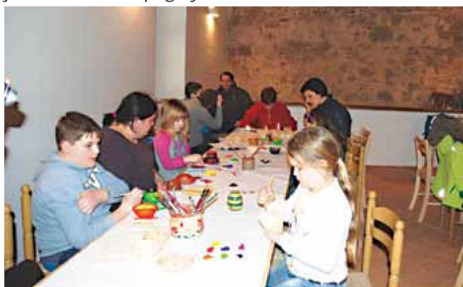
Na velikonočnih delavnicah je vedno zanimivo