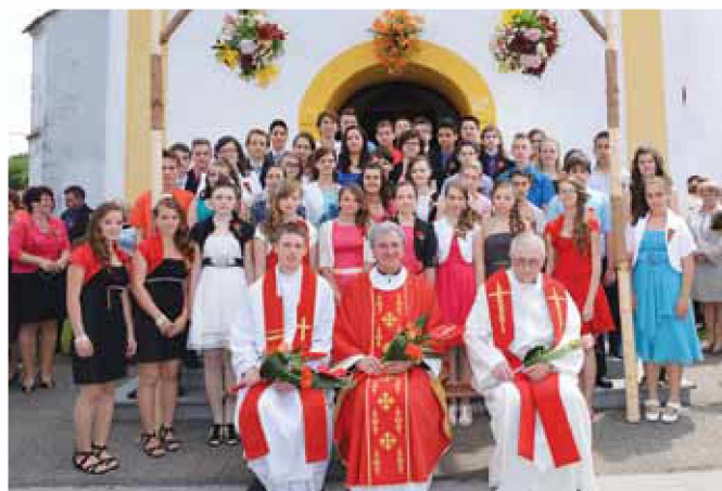
Birmanci gračke župnije