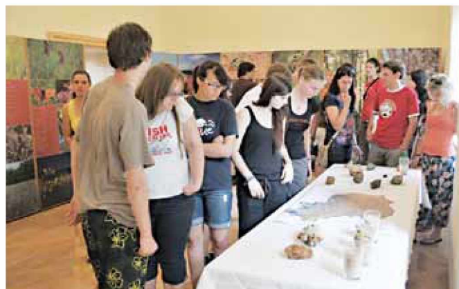
Ob koncu tabora je nastala geološka zbirka

V jubilejnem 10. letu Krajinskega parka Goričko so študentje geologije izbrali Goričko za območje, kjer se je v tednu med 8. in 12. julijem 2013 odvijal organiziran strokovni geološki tabor Geotabor Goričko 2013. Na taboru, ki vključuje teoretično in terensko delo študentov od prvega do četrtega letnika, so študentje nadgradili svoje znanje, pridobljeno v okviru rednega programa na Univerzi v Ljubljani. Tabor so organizirali člani Društva študentov geologije v sodelovanju z JZ Krajinski park Goričko in ob podpori darovalcev. Letošnji tabor, ki je že 17. po vrsti, je imel »sedež« pri Gradu. Študentje so prenočevali na osnovni šoli, medtem ko so pre-