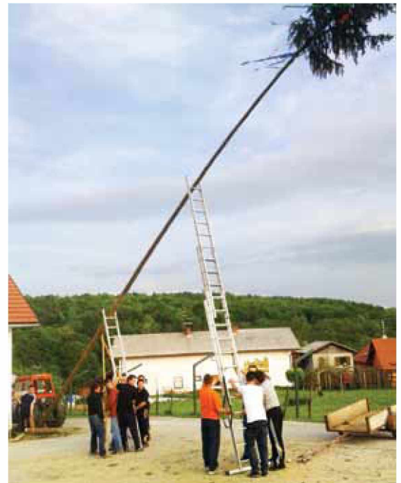
Postavljanje mlaja v Kovačevcih