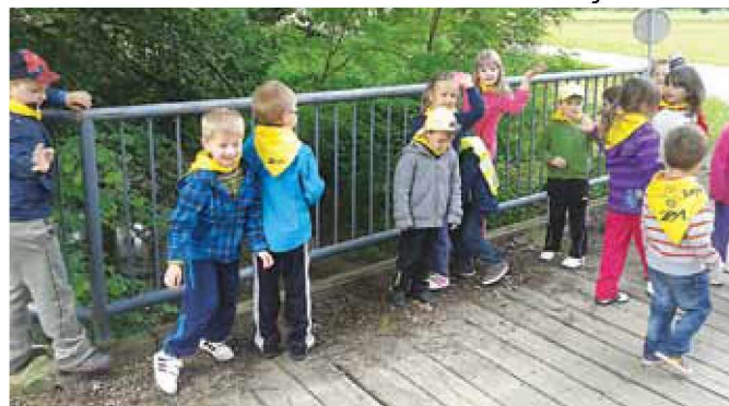
Veselje otrok v šoli v naravi