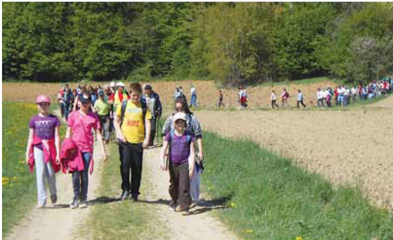
Pohodniki na razgibani poti