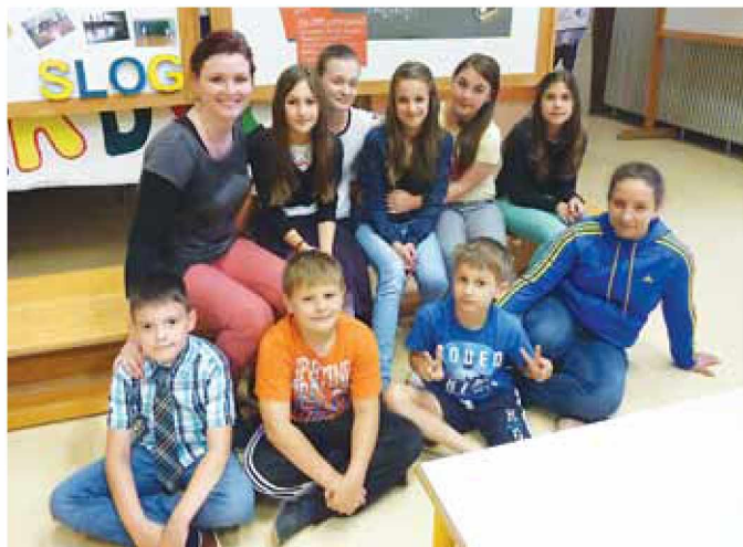
Ni nam vseeno za revne otroke po svetu