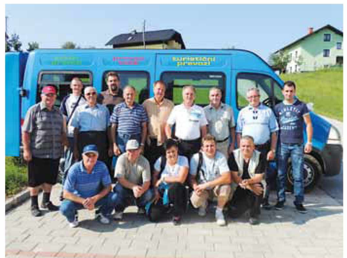
Radovski pohodniki »Od gorce do gorce«

Radovčani so se udeležili že tradicionalnega 9. pohoda »Od gorce do gorce«. Dogodek v okviru praznovanja občinskega praznika Občine Šmarje pri Jelšah vsako leto organizirajo Turistično društvo Skriti biser Sladka Gora, Občina Šmarje pri Jelšah, TIC Šmarje pri Jelšah, PGD Sladka Gora in seveda lastniki ter ponudniki gorc. Gre za krajšo pohodniško pot, ki vodi od doma krajanov in gasilcev na Sladki Gori do osmih gorc in slikarske razstave. V gorcah so na voljo številne dobrote kmečkih gospodinj, domače žganje in več vrst vin. Med potjo so si pohodniki lahko ogledali prikaz košnje, izdelavo kolja za vinograde, izdelavo lončenih izdelkov na lončarskem kolovratu, slikarsko razstavo, hišo pesnika Alojza Hergoutha in cerkev sv. Mihaela. Možen je bil tudi ogled starega gotskega zvona v zvoniku cerkve Sv. Mihaela.