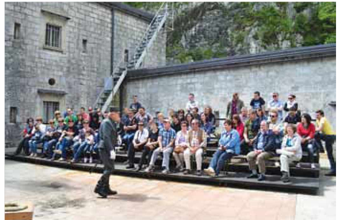
Predstava iz prve sv. vojne v trdnjavi Kluže