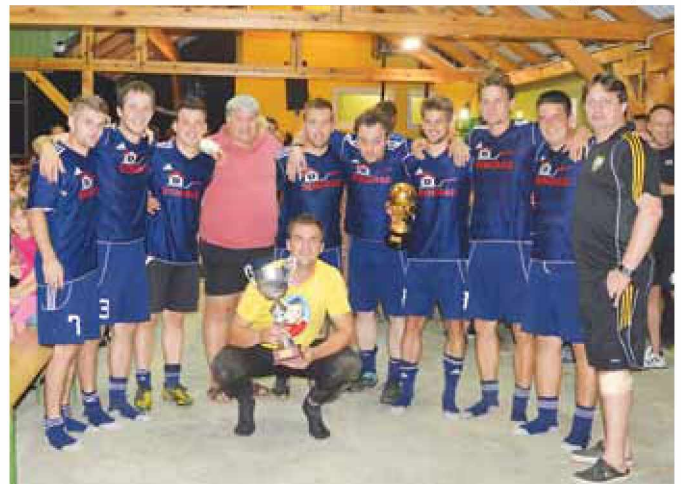
Zmagovalna ekipa KMN Grad