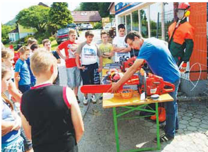
Učenci so bili navdušeni nad stroji in varnostno opremo

Na obisku pri podjetju ŽKG Grad, d.o.o. smo izvedeli, da moramo imeti za delo v gozdu ustrezno osebno varno-