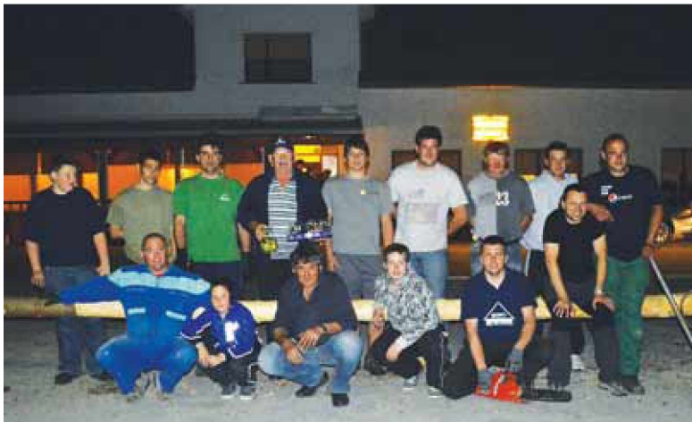
Slavečki moški ob mlaju

Leto je ponovno naokoli. Tako so za nami tudi letošnji prvomajski prazniki. Na predvečer prvega maja je bil ponovno čas, ko so moški poskrbeli za vzdušje v vasi. Na večer 30. aprila so namreč ponovno postavili mlaja. Prvega so postavili pri gasilskem domu na Dolnjih Slavečih, drugega pa pred Okrepčevalnico Forjanič, po domače pri Pütari. Med potjo je ženski del poskrbel za kratke postojanke s pijačo ter namazi. Ob zaključku dela pa so se ob pijači, jedachi in dobri volji veselili v Okrepčevalnici Forjanič. Tako je večer minil, noč se je kar hitro prevesila v dan, in že nas je na koledarju veselo pozdravljala