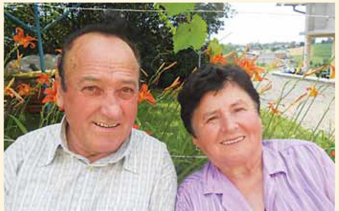
Zlatoporočenca med rožami na njenem domu

Zakonca sta nato skušala nadaljevati skupno pot po že usta-ljenih tirih. Še naprej sta skrbela za dom in majhno kmetijo, hodila s trebuhom za kruhom za dodatni zaslužek, predvsem pa sta nudila najboljše svojim štirim otrokom: Andreji, Mariji, Antonu in Jožetu.