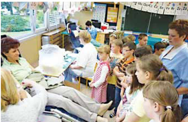
Učenci so si lahko ogledali darovanje krvi