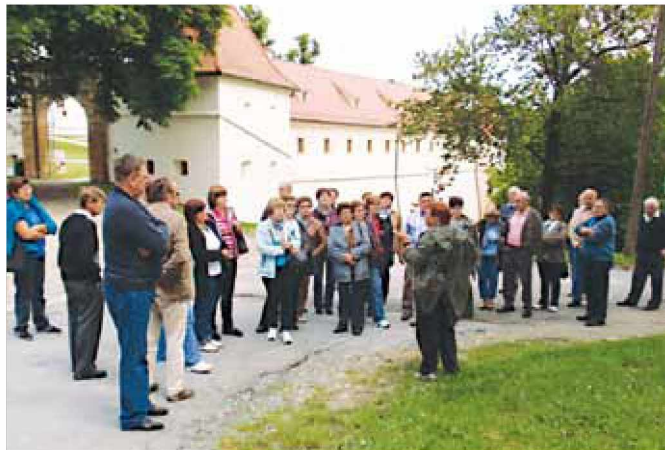
Krvodajalci ob Negovskem gradu