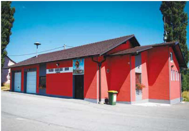
Vaško-gasilski dom Vidonci danes