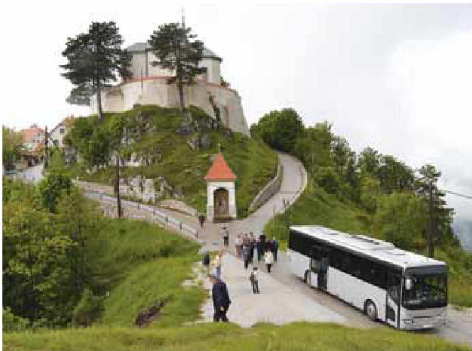
Zasavska Sv. Gora