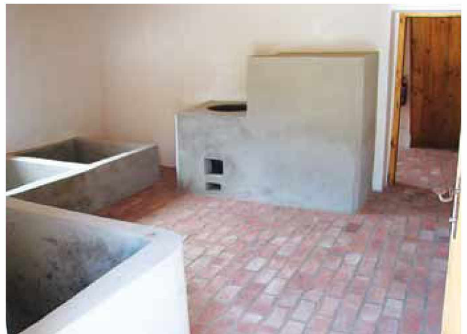
Obnovljen prostor, kjer so predelovali kože