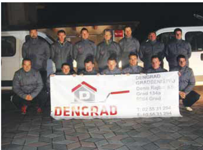
Kolektiv podjetja Dengrad

Podjetje izvaja različna gradbena dela, kot so zidanje, fasaderstvo, urejanje okolice, gradnja na ključ, saniranje objektov ... Njihovo tržišče zajema predvsem domači trg, trideset odstotkov del pa jim pokriva tudi Avstrija.