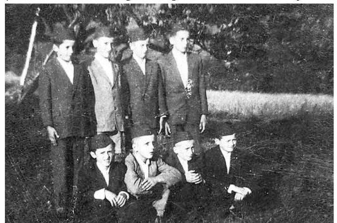
Gasilci pionirji leta 1959 (arhiv PGD Vidonci)

V času 2. svetovne vojne je zaradi vojnega stanja delovanje gasilstva v vasi stagniralo. Podobno se je godilo gasilskim društvom v okoliških vaseh. Ob koncu vojne pa so gasilci zajeli zrak s polnimi pljuči in nadaljevali, kjer so obstali. Kljub težkim časom pa želje po napredku niso zamrle. Tako so leta 1952 nabavili ročno štirikolesno brizgalno in dodatno opremo ter začeli razmišljati o gradnji gasilskega doma, kajti gasilska oprema je bila spravljena v manjši orodjarni, nekaj pa tudi po domovih članov. Obstajal pa je še en velik problem. Namreč oskrba s požarno vodo, zato so leta 1953 sprejeli sklep o ureditvi mlak s požarno vodo. Vas Vidonci so razdelili na 5 sektorjev, v katerih so pristopili k ureditvi požarnih mlak. Istega leta so prvič praznovali obletnico gasilskega društva in sicer dvajseto.