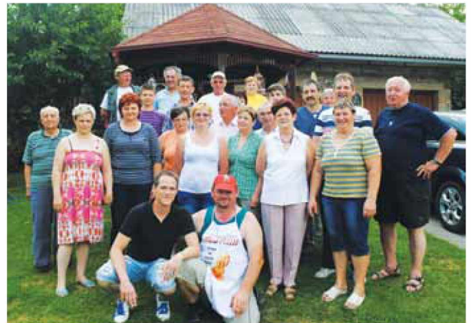
Čebelarji na pikniku v Radovcih