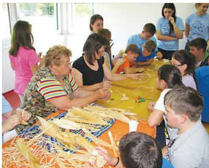
Izdelovanje izdelkov iz koruznega ličja