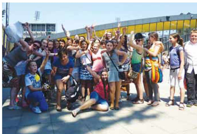
Veseli udeleženci Zborovskega buma