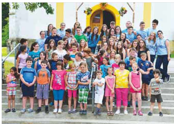
Udeleženci oratorija iz župnij Grad, Kuzma in Sv. Jurij