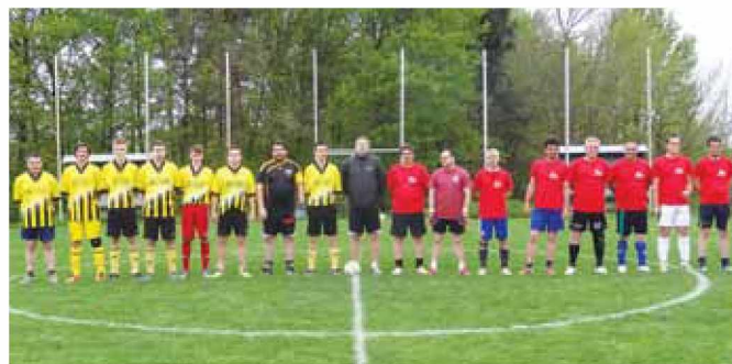
Domačini z zmagovalno ekipo Dengrad