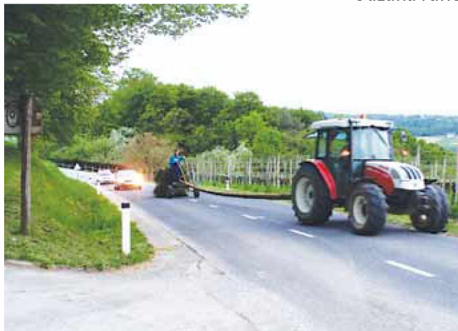
Vožnja mlaja do gasilskega doma v Radovcih