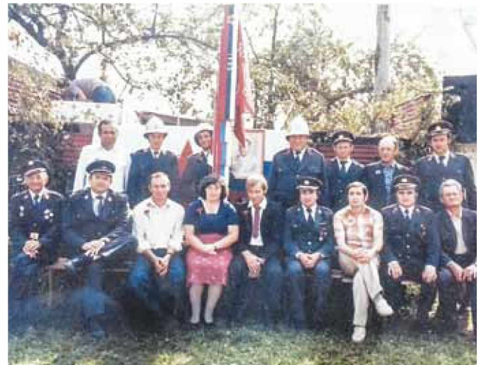
Razvitje prapora leta 1982