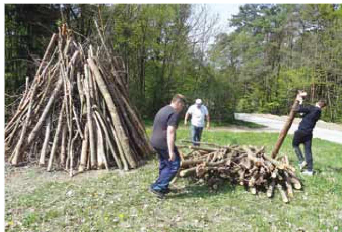
Priprave na kresovanje