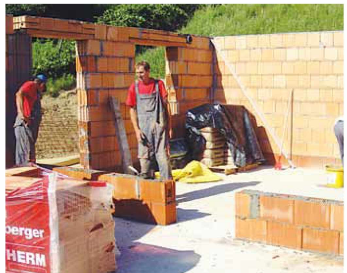
Gradnja hiše