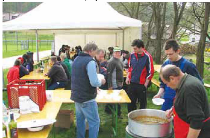
Za prostovoljce vsako leto naši lovci skuhamo bograč

Letos je v naši občini zato očiščevalna akcija potekala v manjšem obsegu, saj so prostovoljci čistili poti, ceste, obcestne jarke, potoke, pohodne poti, okolico igrišč, šole in drugih javnih ustanov ter seveda okolico svojih domov. Zaradi slabega vremena se je akcija odvila šele 20. aprila. Po dolgotrajni zimi in dežju nas je tisto soboto pričakal lep sončen dan. Prostovoljci so z veliko vneme čistili vsak svojo vas. Zbrane smeti so ločevali v rumene in črne vreče, ki so jih naši delavci nato odpeljali v zbirni center v Vidoncih. Po