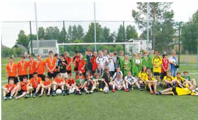
Ekipe turnirja z medaljami