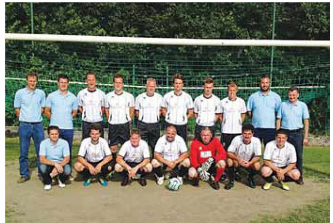
Podjetje Dengrad v nogometnih dresih izven delovnega časa