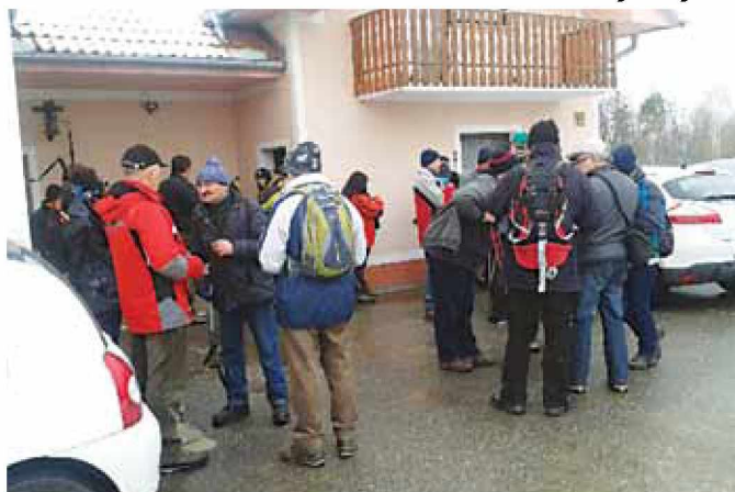
Pohodniki na začetku poti