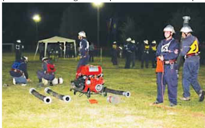
Gasilci na tekmovanju

Poleg odličnih predstav tekmovalnih desetih so se številni obiskovalci zabavali tudi na pravi gasilski veselici. Svoje pete so si brusili ob glasbi skupine Weekend Band in pev-