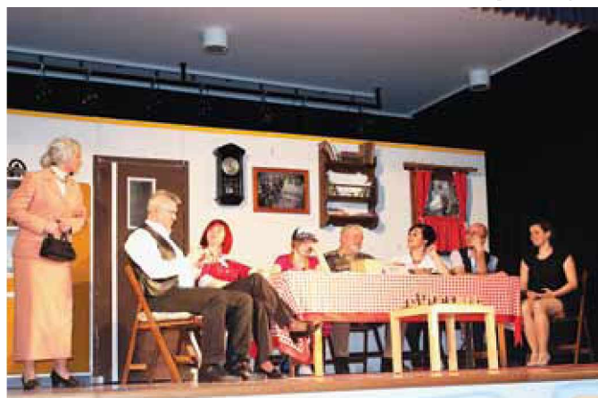
Uprizoritev predstave v dvorani pri Gradu