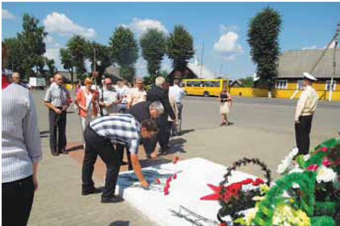
Polaganje rož na spomenik osvoboditeljem