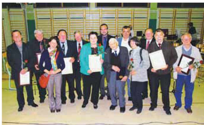
Podelitev zahvalnih listin županom in predstavnikom goričkih občin