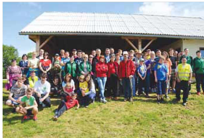
Pohodniki po Kovačevcih

Letos se je tudi Športno društvo Kovačevci odločilo, da organizira prvi pohod po Kovačevcih. Kovačevci niso velika vas, vendar je bila proga, ki je bila speljana okrog vasi, dolga okrog 8 km. Na sam dan pohoda se je zbralo nekaj več kot 50 pohodnikov, kateri so bili popeljeni po peš