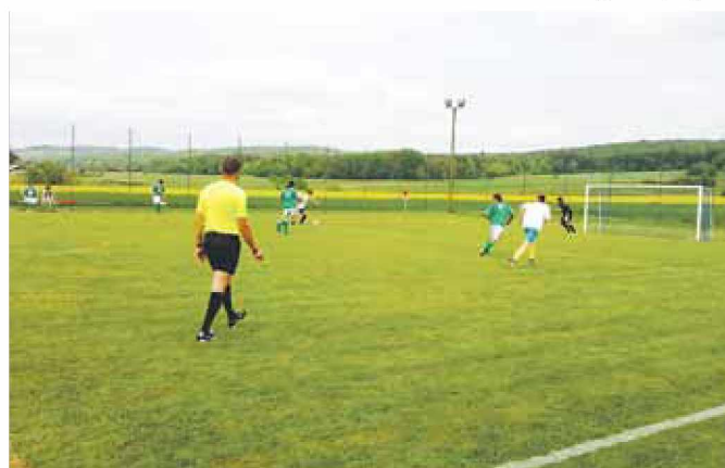
Na turnirju