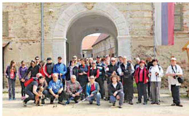
Pohodniki 3-deželnega pohoda pred gradom Grad

Zemlja čudovita si, ostani naš zdrav dom in čuvaj nas pred nespametnimi posegi, ki škodujejo tvojim prebivalcem. Vse najboljše vsem Zemljanom!