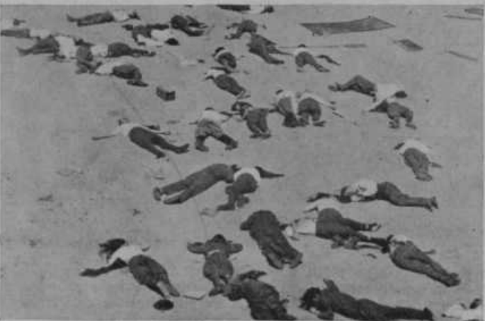
Žrtve, ki so obležale na bojišču v bratomorni španski revoluciji.

Grozotna poročila, ki prihajajo iz Španije so mnogokrat neverjetna, vendar jim moramo verjeti, če so dokazana s fotografijami dogodkov. Ko so dobili po zadnjih volitvah posebno mladi komunisti večjo korajžo in tudi vpliv na Špankem, so z vso brezobzirnostjo mladih ljudi uveljavljali svoja načela. Kot brezbožnikom je bila komunistom najbolj na poti katoliška Cerkev. Požigati so začeli samostane in cerkve, pobijati duhovnike in redovnike ter oskrnjati svete reči. Prizanašali tudi niso veleposestnikom, ki so se branili dati svojo zemljo. — V tej držav-