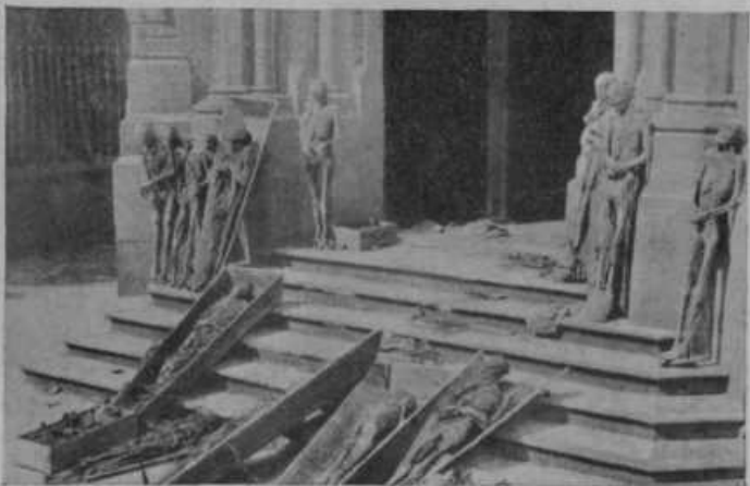
Krste s trupli pred cerkvijo, ki jih je oskrnjala razdivjana tolpa.

ljanski vojni se borita prav za prav druga proti drugi le dve sili: komunisti in socialisti, ki so na vladi ter opozicija z vojaštvom, podprta od veleposestnikov, monarhistov in drugih. Že takoj v početku državljanske vojne so vladine komunistične in socialistične bojne skupine zakrivile grozodejstva, ki jih kažejo naše slike. Uporniki, ki so se od začetka borili zelo obzirno in niso niti ujetim komunistom in socialistom prizadeli nič hudega, so sedaj začeli vračati milo za drago. In tako teče v Španiji kri v potokih, a še ni pričakovati kmalu konca te grozne bratomorne vojne.