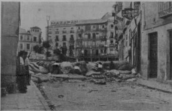
Poulični boji v Madridu. Na ulici so si napravili zaslone in pod njihovo zaščito streljajo drug na drugega.

Grozotna poročila, ki prihajajo iz Španije so mnogokrat neverjetna, vendar jim moramo verjeti, če so dokazana s fotografijami dogodkov. Ko so dobili po zadnjih volitvah posebno mladi komunisti večjo korajžo in tudi vpliv na Špankem, so z vso brezobzirnostjo mladih ljudi uveljavljali svoja načela. Kot brezbožnikom je bila komunistom najbolj na poti katoliška Cerkev. Požigati so začeli samostane in cerkve, pobijati duhovnike in redovnike ter oskrnjati svete reči. Prizanašali tudi niso veleposestnikom, ki so se branili dati svojo zemljo. — V tej držav-