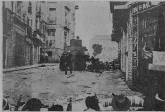
Vladna skupina napada pod zaščito oklopnega avtomobila.

ljanski vojni se borita prav za prav druga proti drugi le dve sili: komunisti in socialisti, ki so na vladi ter opozicija z vojaštvom, podprta od veleposestnikov, monarhistov in drugih. Že takoj v početku državljanske vojne so vladine komunistične in socialistične bojne skupine zakrivile grozodejstva, ki jih kažejo naše slike. Uporniki, ki so se od začetka borili zelo obzirno in niso niti ujetim komunistom in socialistom prizadeli nič hudega, so sedaj začeli vračati milo za drago. In tako teče v Španiji kri v potokih, a še ni pričakovati kmalu konca te grozne bratomorne vojne.