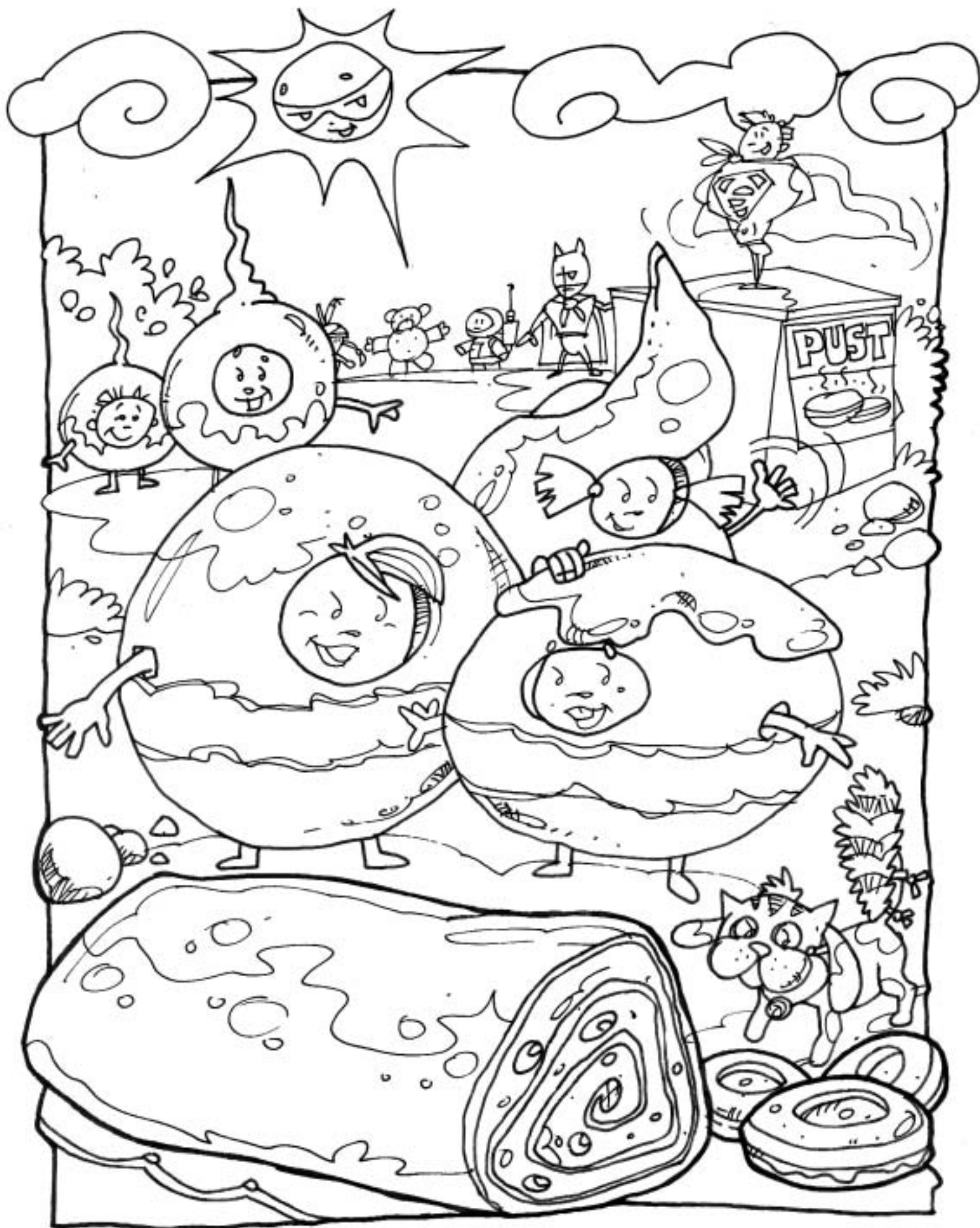
Nagrajenka pobarvanke iz prejšnje številke je Lana Žun, Pustnice 20, 1217 Vodice.