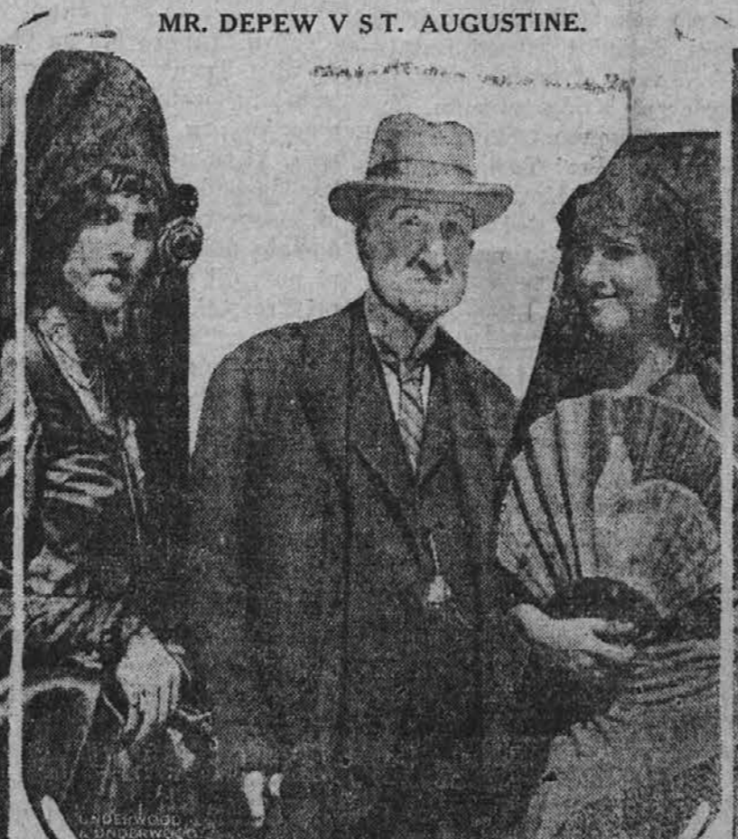
MR. DEPEW V S. T. AUGUSTINE. S. M. Depew, še vedno čil in zdrav v starosti 90 let. Na gorenji sliki ga vidimo v pogovoru z dvema krasoticama v vrtu Ponce de Leon hotela v St. Augustine, Fla. Drugi mesec bo tukaj velika slavnost, dekleta na tej sliki, sta kandidatnji za slavnostno kraljico.

Chicago, Ill. — Proti severu vozeči tovorni truck na Cicero Ave. je zadel v srednji konec kare vozeča proti jugu v bližini Palmer Ave. Sunek je bil tako silen, da so potniki, večinoma delavci, vozeči se na delo, popadali s sedežov. Eden od potnikov, ki je bil spredaj, je zadobil tako težke poškodbe, da je na mestu izdihnil. Voznik avtoja je pa zadobil tako težke poškodbe, da ni upanja, da bi okrevl. Ostali potniki so zadobili le lahke poškodbe od stekla, ko so se pri sunku razbila okna pri kari. Nesreče je kriv voznik avtoja, kateri je premalo pazil. Polcija je tudi dognala, da je imel na avtoju steklenico žganja.