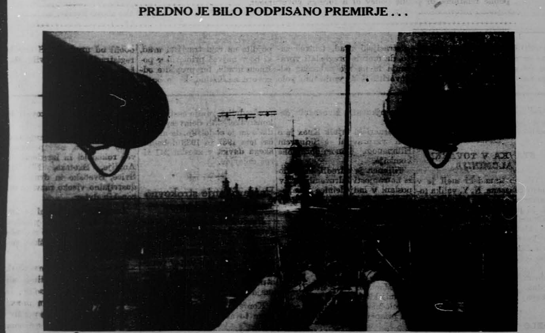
Francoske bojne ladje v Sredozemskem morju, predno je bilo podpisano premirje z Nemčijo. — Večino teh ladij so Angleži zapolnili, ostale pa potopili, da ne bi padle v nemške roke.

"Glas Naroda" 216 WEST 18th STREET NEW YORK, N. Y.