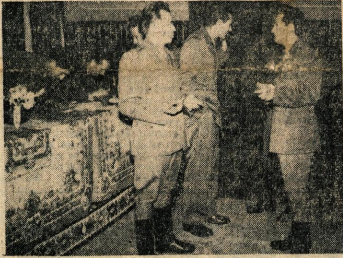
Med odmorom na konferenci v Domu JLA