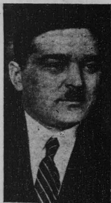
Dr. Milan Stojadinović

Kmalu po hišni preiskavi je bil Stojadinović aretiran in je bil pod močno stražo odpeljan iz Beograda na Rudnik, kakih 80 milj južno od Beograda, da bo ločen od tujih agentov in svojih političnih pristašev, ki so pred enim letom z njim izgubili vso veljavo in vpliv.