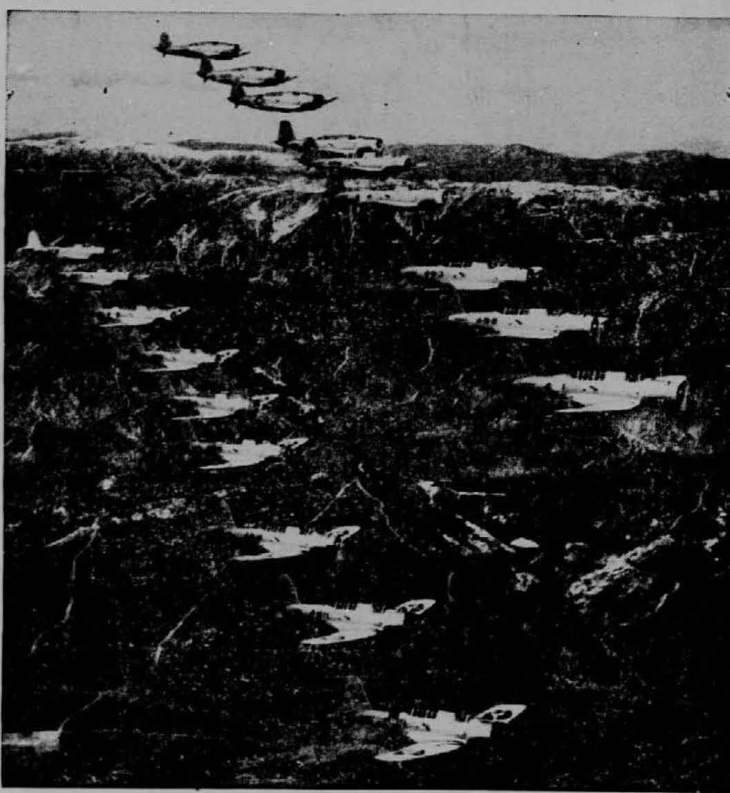
Bombniki ameriške vojske na manevrih blizu San Diego, Cal.