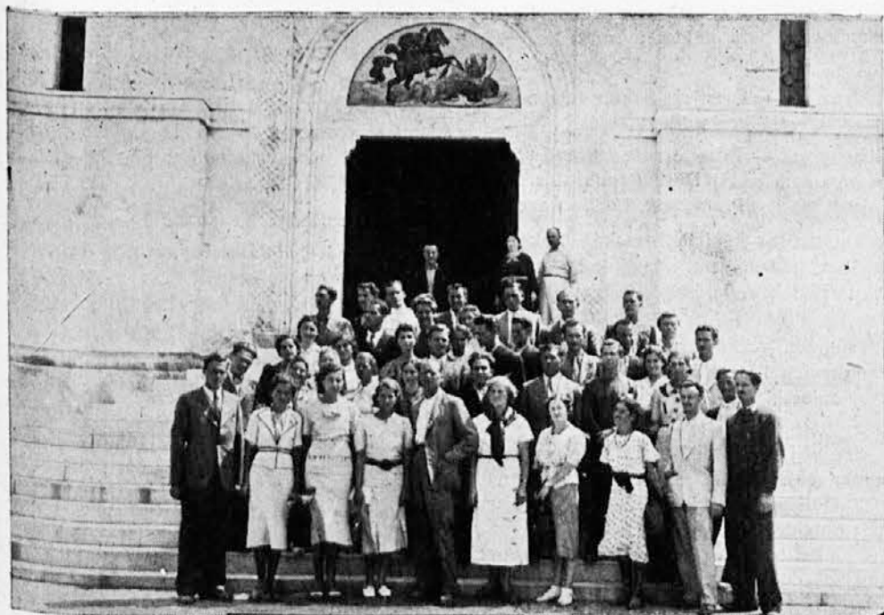
Članovi Stručnog odbora Sokolske župe Beograd na Oplencu

kmetje pred skoraj 500 leti ob rami z brati Srbi borili pod obzidjem Beograda proti sinovom polumeseca. Ruška „Miklova Zala” je navdušila vse prisotne ter vplivala ob enem vzgojno in domoljubno.