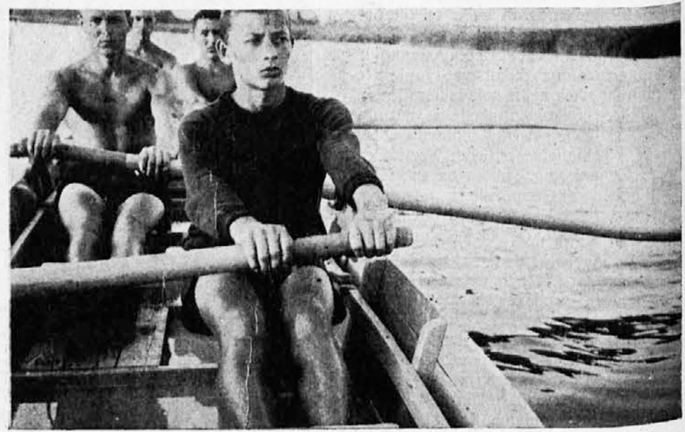
Sa prve naraštajske škole Sokolske župe Novi Sad, održane na „Sokolovcu“ kod Subotice