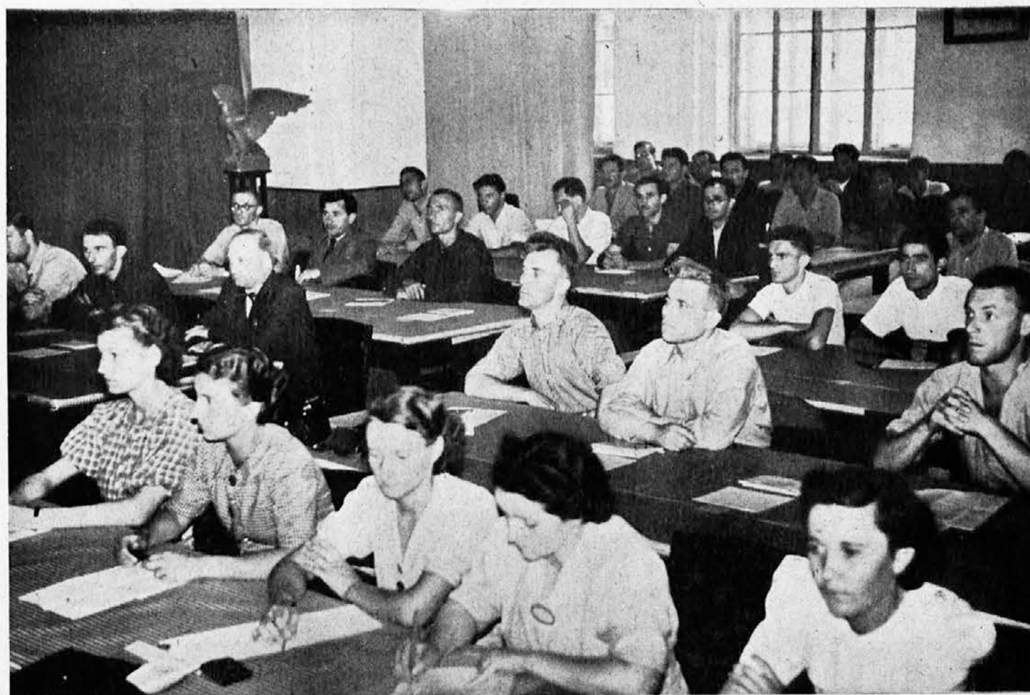
U školi za vreme predavanja