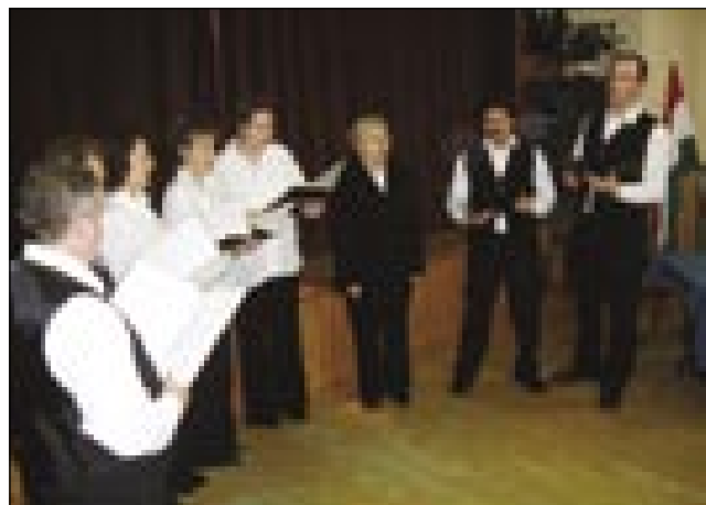
Gornjeseniški ljudski pevcu so na predstavitvi spopejvali dve pesmi

djamavati iz tisti mnaugi pesem, ka ji ške majo na paleti. Stokovnjaki so spunili željo pevcov s tejm tü, ka je kasete z 19 pesmimi, stero je posaba prosila naprajti Slovenska zveza, dobila za naslov Sonce gre za goro. Mlade pevke pa pevcu so vredni vse pohvale pa čestitke. Žmetne reči, douge, žalostne pesmi, stare balade navčiti se, je dosta tröjda, švica, trpljenja, časa, velko volo pa samoza vest (öntudat) želelo. Muzej